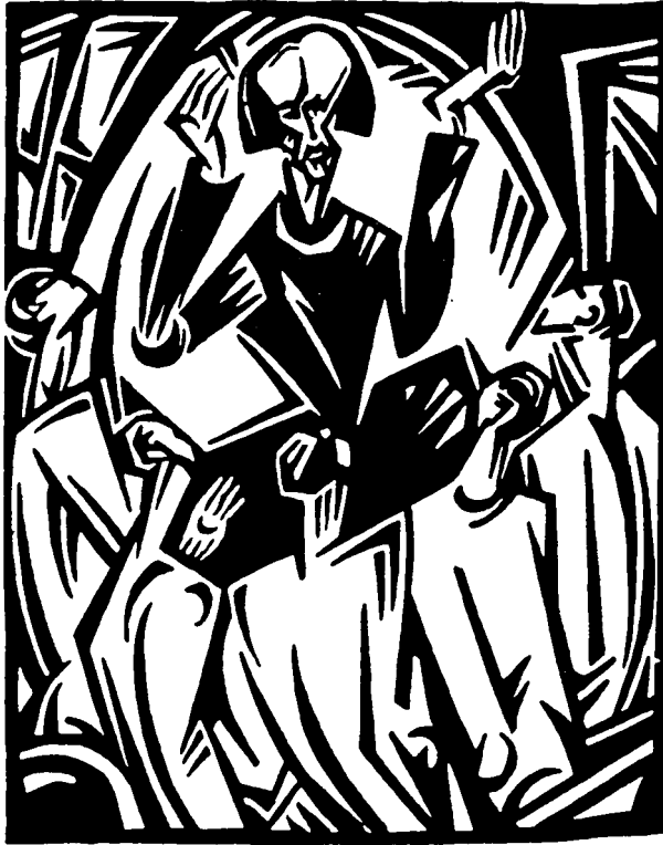
Sándor Bortnyik. Porträt von Kassák. 1920

Dem Prototyp des kollektiven Individuums , seinem Erlöser -Typ, hat Kassák im Kapellmeister, in abendlicher Beleuchtung 1916 poetische Gestalt verliehen: