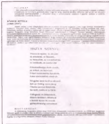
József Attila: Tiszta szívvel (Bori Imre: Olvasókönyv a középiskolák III. osztálya számára

A Klárások kapcsán a magyarázó szöveg a cím értelmezése mellett a dal műfaji sajátosságait taglalja. A Klárások műfaja dal, „még hozzá nem a XIX. századtól örökölt, Petőfi Sándor szentesítette formája, hanem a modern változata, amely inkább ősi kultikus dalokhoz nyúl vissza, amikor szabad dalformát akar alkotni.” A feladatok a szürrealista költői megoldások és az ellentétek megkeresését, továbbá a névszókából és névelőkből építkező vers szófaji vizsgálatát, a nominális kifejezésmód megfigyelését irányozzák elő.