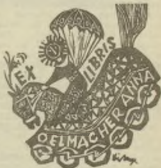
Diskay Lenke fanetése Bordás Ferenc fanetése