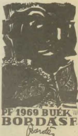
Bordás Ferenc fametszete