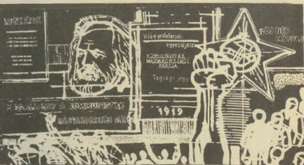
Rassler Károly rézkarca