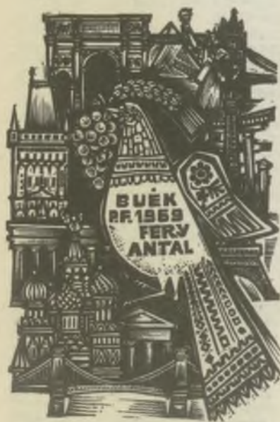
Fery Antal fametszetei