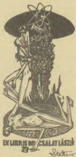
Stettner Béla fametszete