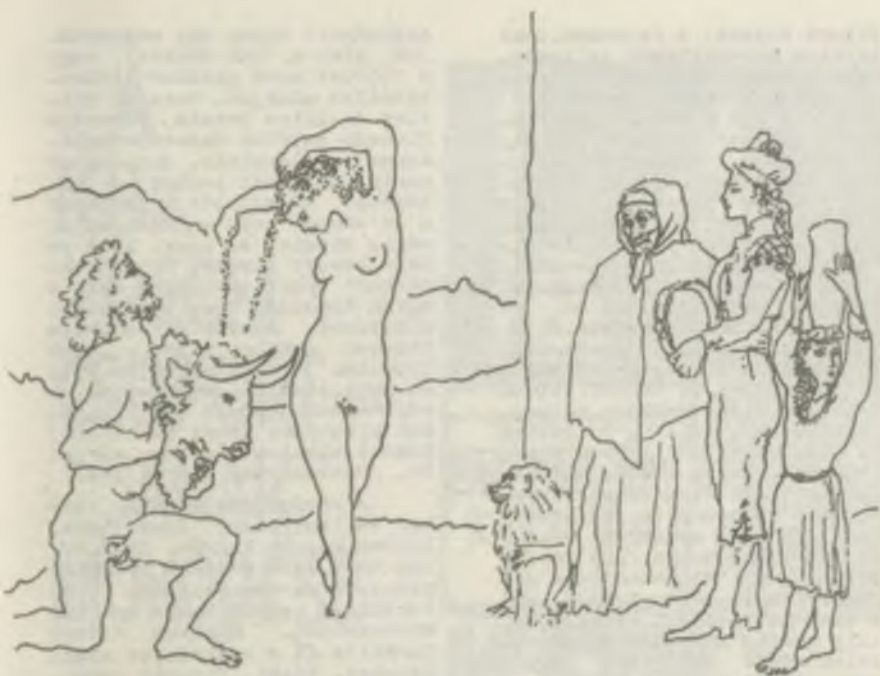
Bandillerók tánc /1954. litográfia/

de az emberiség útja is lemérhető a képeken, a csendes évek nyugalma éppúgy, mint a háborútól való iszonyat, vagy a minden emberrel egytestvér kommunista Picasso magabiztos nyugalma. Aki végignézi a kiállítást azt foglyul ejti „bőség zavara” s az élmények elrendeződéséhez hetek kellenek. S aki teheti kezdi előlről s újra megnézi a kiállítást, mert Picassoval nem lehet betelni.