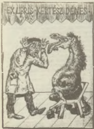
ÓÁCSI Mihály: Részke