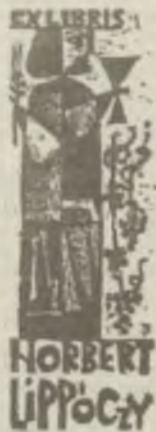
DISKAY Lenke: lánmetesete