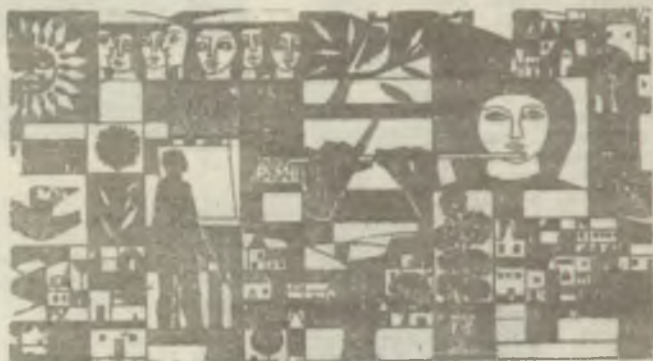
GÁCS Gábor: Részke