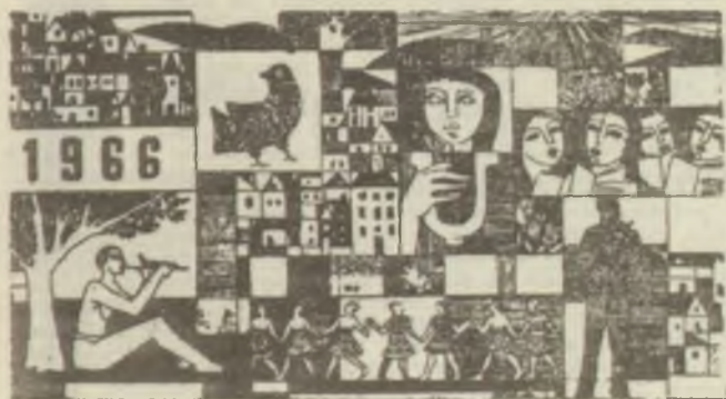
GACS Gábor: A KKI részére készített újévi lapja