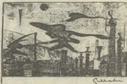
Gy. Molnár István rézkarca