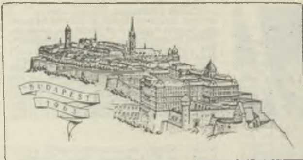
Gál Ferenc rézmetszete