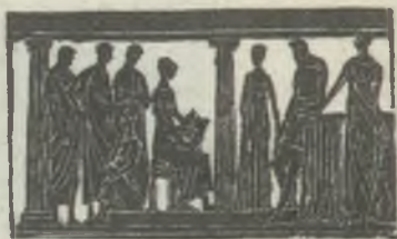
Stettner Béla linómetazete