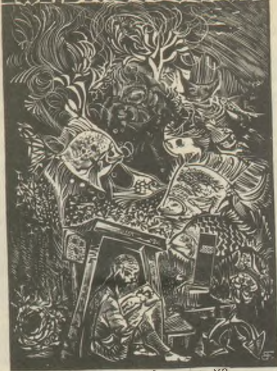
Bordás Ferenc fametszete X2