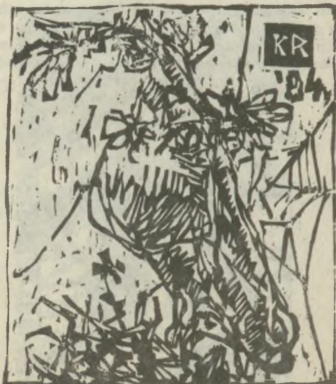
König Róbert metszete X2