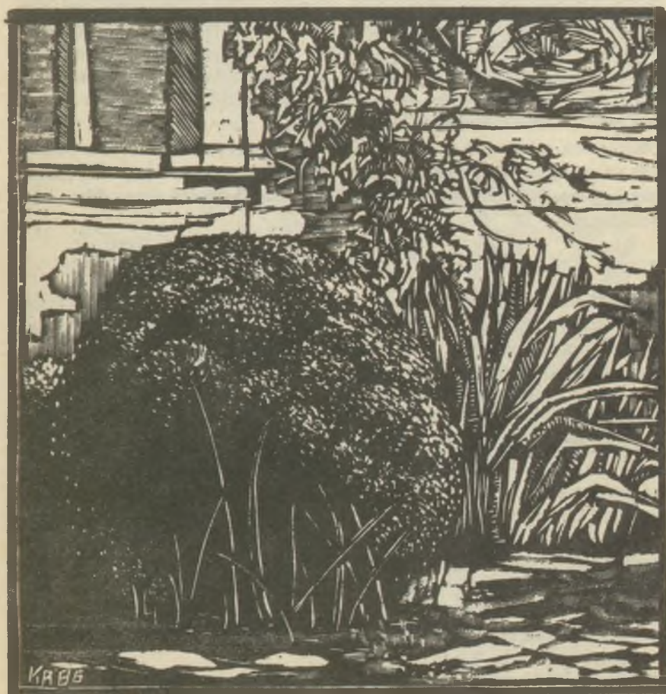
König Róbert linómetszete X3