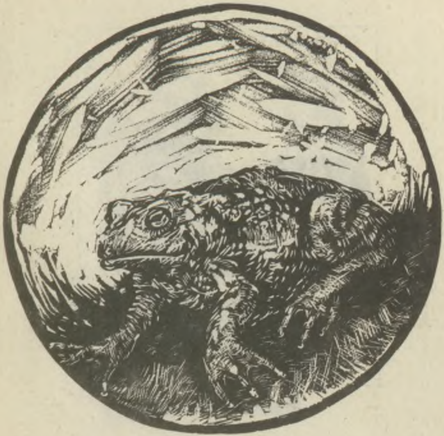
Pásztor Csaba metszete X3