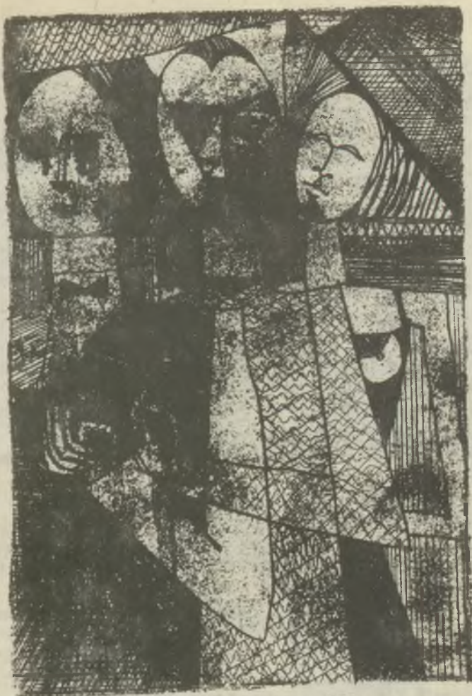
Tellinger István rézkarcai C3