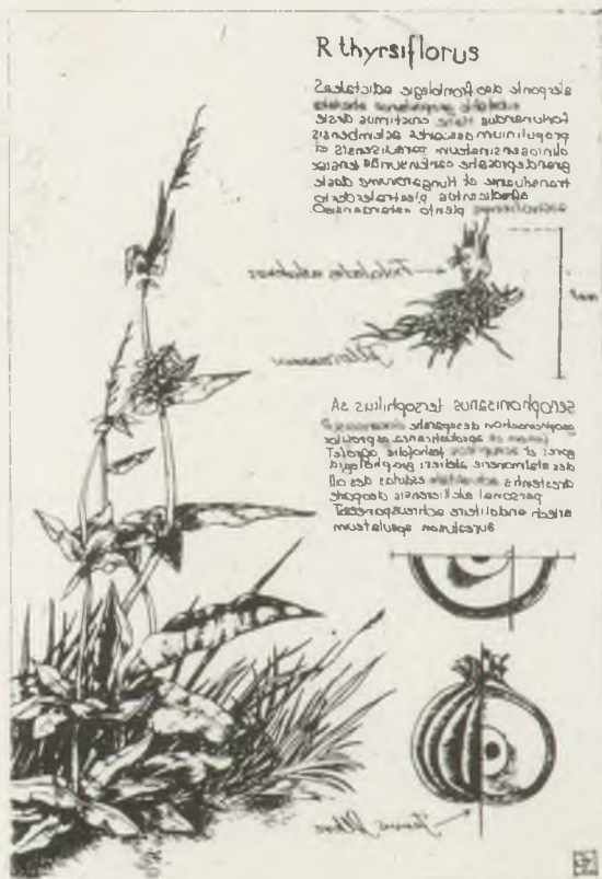
Jánváry Zoltán metszete C2