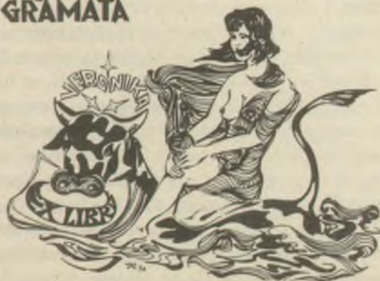
Vilnis Resnis rajzai P1