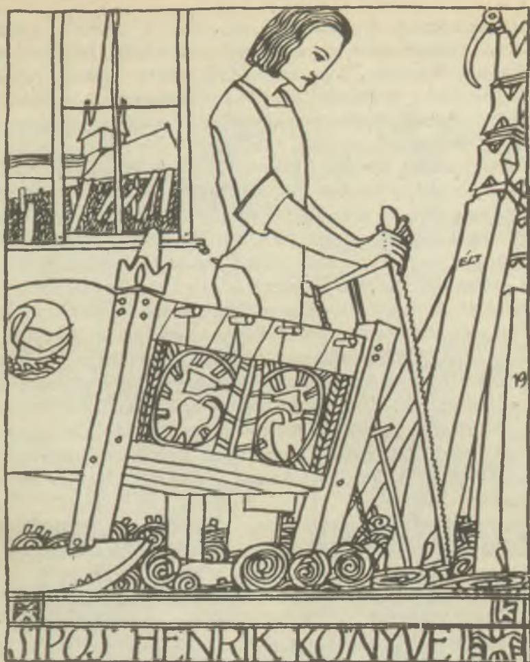
A Ház pályázatai – 1908, 1909