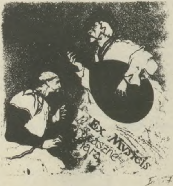
Bálint Ferenc rézkarca C3

KMETY FERENC grafikusművész, a KBK egyik legrégebbi tagja, 1986. április 12-én, életének 82. évében elhunyt. Munkásságát elsősorban az alkalmazott grafika területén fejtette ki: számos belföldi és külföldi kiállítás megrendezése fűződik nevéhez. Életbölcességét, szerénységét, a művészetért lelkesedő egyéniségét sokan tisztelték Körünkben. Emlékét megőrizzük!