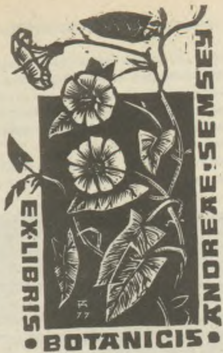
Fery Antal metszetei X2