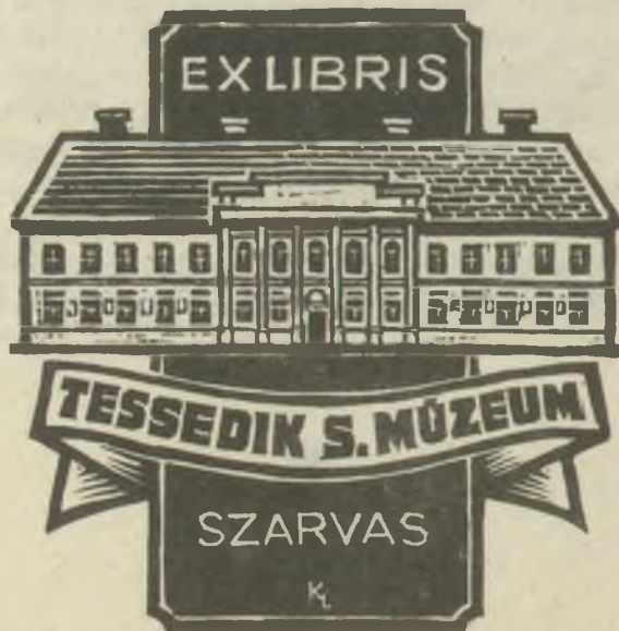
Kékesi László metszete X2

szólék: Uram! Néked málhám, amit visz, nem tudom, azzal kincstárad nyer-e (?): Im, könyveim, s bennük: „V. Z. ex libris” . . .