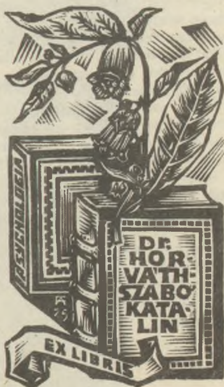
Fery Antal fametszete X2