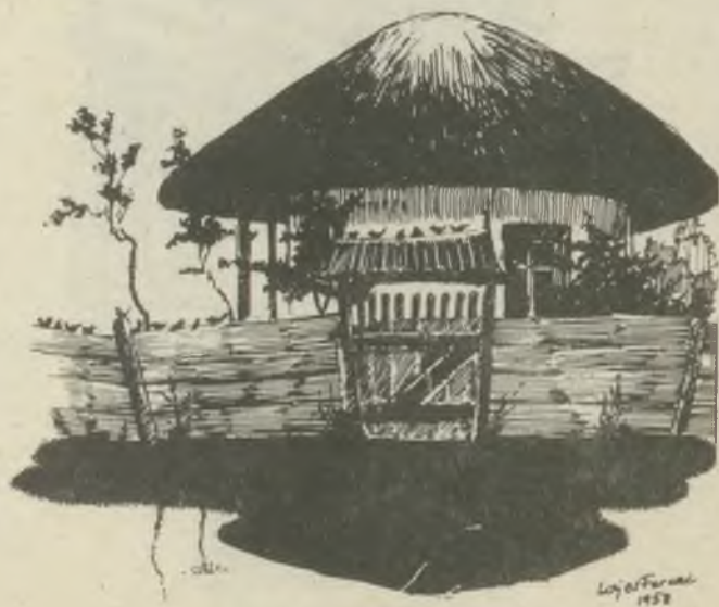
Lajos Ferenc rajza

LAJOS FERENC grafikusművész alkotásaiból rendezett májusban kiállítást a Győri Városi Könyvtár. Körünk tagja, az 1912-ben született művész ez alkalommal három korábbi nagyméretű grafikai sorozatát és az utóbbi időben készült rajzait mutatta be. Az 1938. évből való „Ázsia” mellett az Ady- és Dante-illusztrációk sorozata szerepelt a tárlaton, melyet Salamon Nándor művészettörténész rendezett és nyitott meg.