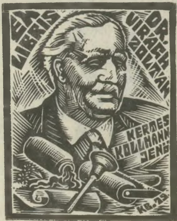
Kósa Bálint metszete X2

Az 1956-ban megalakult Pirckheimer Társaság a fenti címmel jelenteti meg az NDK könyvbarátainak hivatalos lapját. A kiadvány napjainkban évente négyszer, példányonként 120 oldal terjedelemben lát napvilágot. Cikkei főként könyvművészeti kérdésekről szólnak, de az exlibris-élet híreiről, az ilyen kiállításokról is olvashatunk benne. Első száma 1957 januárjában került ki a nyomdából, mindössze 24 lapon. Azóta a lap terjedelme megnőtt, s a sorozatban a mostani szám éppen a századik! A jubileum alkalmából a szerkesztők visszatekintenek a kiadvány közel három évtizedes történetére, mi pedig ezúton kívánunk német barátainknak további eredményes évtizedeket!