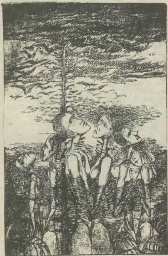
Kamper Lajos rézkarcá C3