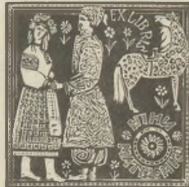
Нy. I. Sztratilat műanyagmetszetei