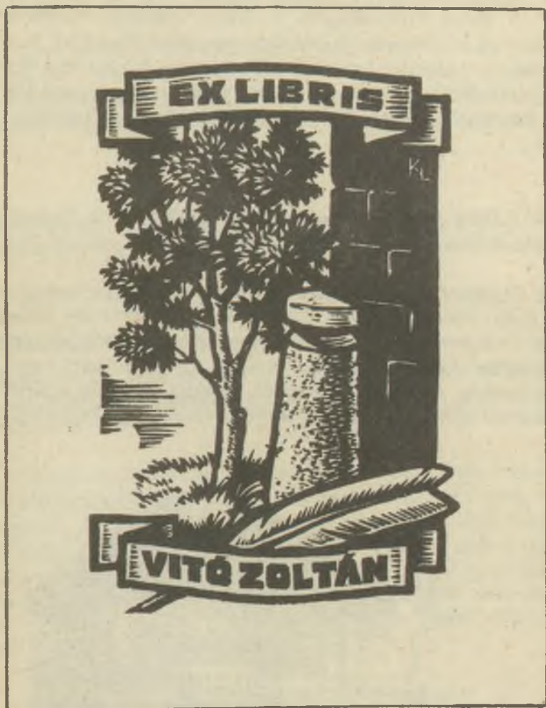
Kékesi László linómetszete X3