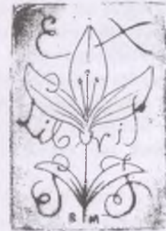
Borsos Miklós rézkarca, C3