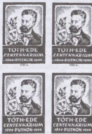
Fery Antal grafikája