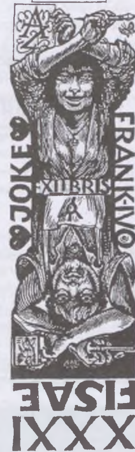
Frank Yvo v. Damme Op. 445 / X2 / 2006