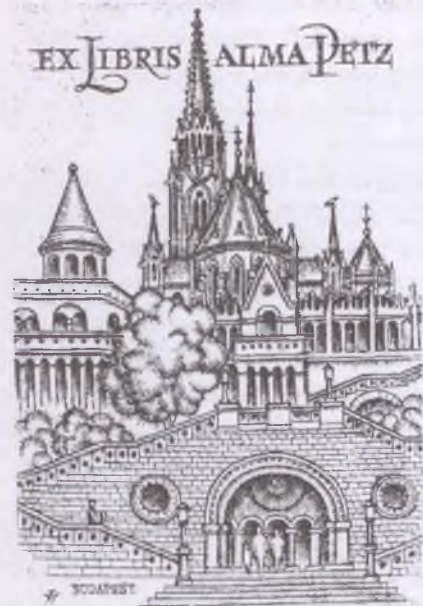
Vertel József rézmetszete, C2