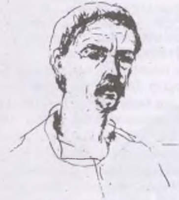
Borsos Miklós önarcképtusrajz, P1