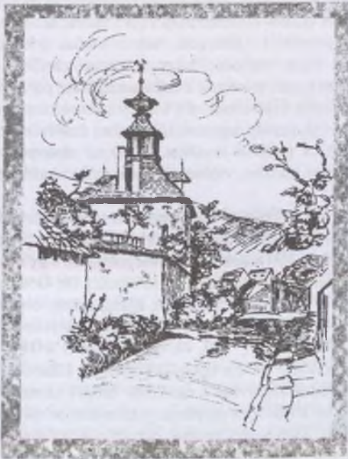
Varga Péter tusrajza, P1

Hasonlóan látszik a japán elegancia a „Virágvasárnap” című lapon. A nagy levegős térben kicsike pont a samarháton ülő Krisztus alakja.