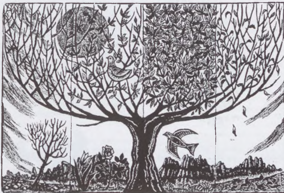
Oriol Divi: a négy évszak. Tusrajz, P1