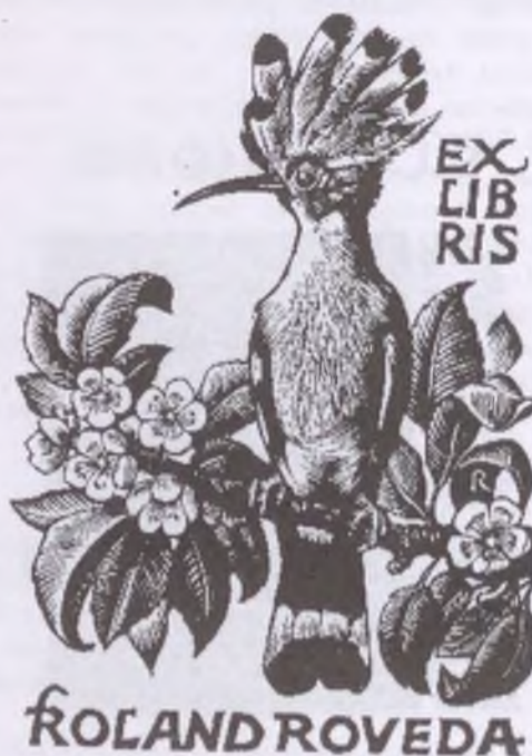
Pam Rueter fametszete, X2