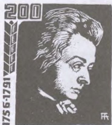
Fery Antal fametszetei, X2