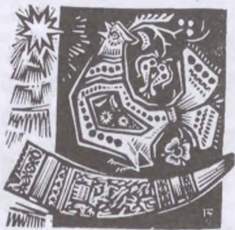
Jászberényi Városi- Járási Könyvtár