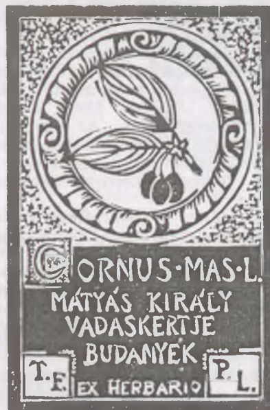
Ürmös Péter linómetszete, X3

Kezdetben 500, később 100 nyomat készült dúcoként. A lapok közgyűjteményekbe, gyűjtőkhöz és alkalmi érdeklődőkhöz kerültek. A dúcokat a Zempléni Múzeumnak ajándékoztuk.