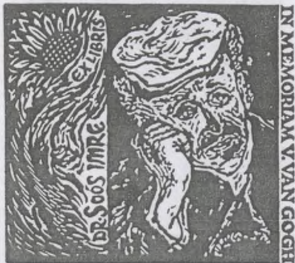
Vincze László linómetszete, X3