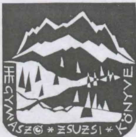
Salamon Árpád linómetszete, X3

Könyvszemléjünkben Salamon Árpád (1930) szlovéniai grafikus könyvét ismertetik, mely a művész 75. születésnapja alkalmából jelent meg. Életrajzának közlése után néhány tucat fekete-fehér könyvjegyet is bemutatják, elismerve azok átütő erejét. Nem rejti azonban véka alá a szerkesztő nemtetszését amiatt, hogy az illusztris alkotó életművében több pseudó-exlibris is található.