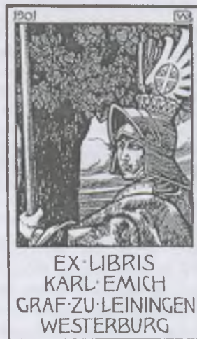
Wenig, Bernhard tusrajza, PI 1901

A NORDISK EXLIBRIS TIJDSKRIFT 2006/1. száma vezércikkben emlékezik meg gróf Leiningen-Westerburgról, halálának 100. évfordulója alkalmából. (A név nekünk, magyaroknak, az aradi szomorú eseményeket idézi.) Az 1856-ban Bambergben született gróf a katonai pályát választotta és a kasseli huszárezred adjutánsaként szolgált. Sikeres katonai pályafutása mellett szenvedélyes művészetbarát is volt, aki 1901-ben könyvet jelentetett meg a német és osztrák könyvjegyekről. Ezt napjainkban „Leiningen-Westerburg” névvel emlegetik a szakirodalomban.