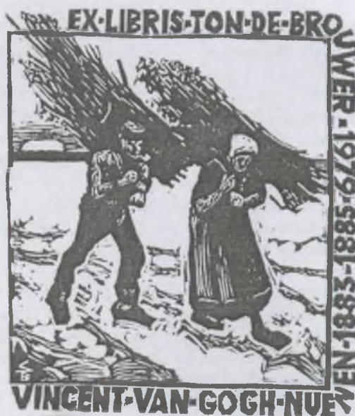
Stettner Béla linómetszete, X3

2003-ban, a festő születésének 150. évfordulója alkalmából a hollandiai Nuenen városban működő VAN GOGH DOKUMENTÁCIÓS CENTRUMBAN kiállították az európai országokban készült ilyen kisgrafikákat. Itt a magyar művészek egyedülállóan tekintélyes számban szerepeltek, amint azt a Ton de Brouwer által összeállított, pompás katalógus is megőrökítette.