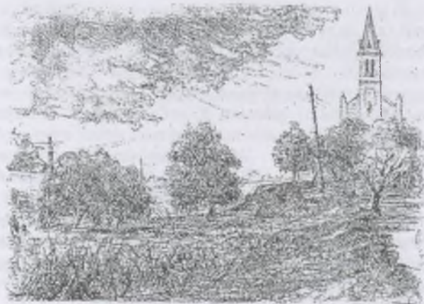
Moskál Tibor rézkarca, C3/C5