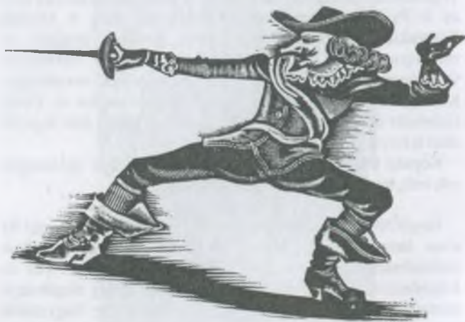
Molnár C. Pál fametszete, X2