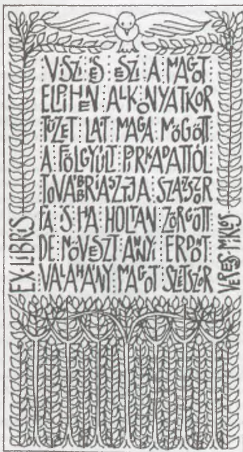
Bornemissza Rozi tusrajza, P1