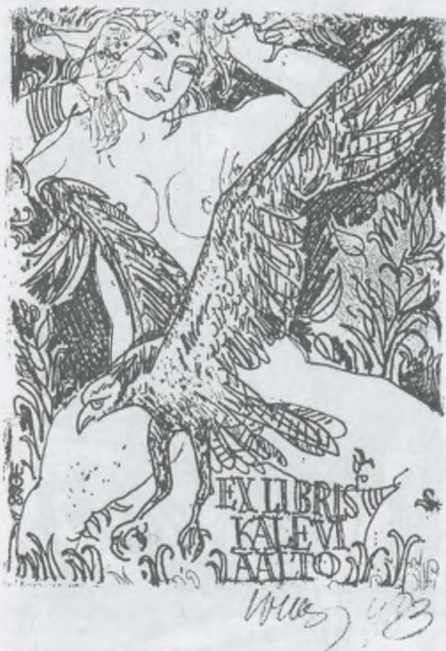
Evald Okas rézkarca, C3

ugyancsak szerepelnek lapjain. A Picasso-ról készült könyvjegye különös festői világot nyit meg a néző előtt. Mégis a legnagyobb jártasságot kedvenc témájánál, a nőkről készült lapjainál tapasztalhatjuk. Többször nyilatkozott már úgy, hogy ez a téma áll hozzá legközelebb.