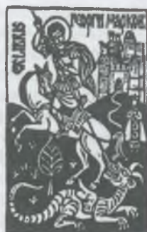
opus 503 X3 [98x65]1998