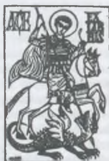
opus 445 X3 [105x75]1992