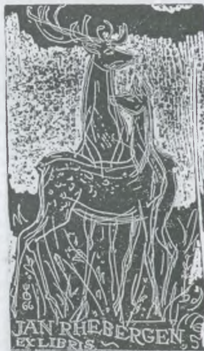
Evald Okas rézkarca, C3