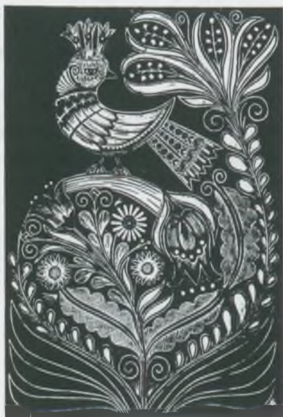
Az árgyélus kismadár Tavasz Noémi linómetszete, X3

Rubriques ultérieures: Nouvelles, Revue de presse.