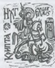
opus 104 X3 [100x65] 1979