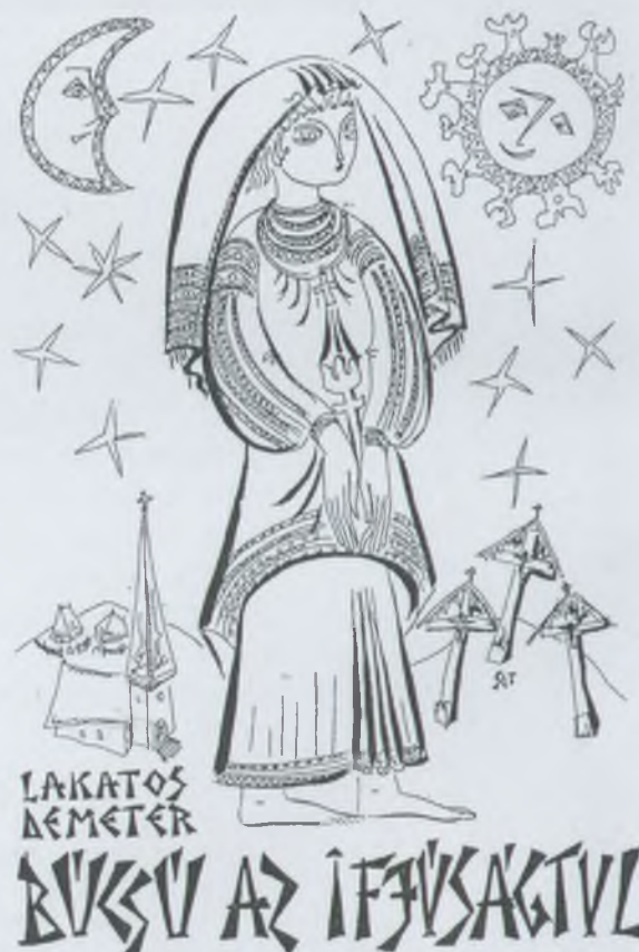
Szervátiusz Tibor tusrajza, P1

Anyagi helyzetünk általában stabilnak mondható. Bár a 2001-ben 1200Ft-ra emelt tagdíjat 2 éve 1500 Ft-ra kellett emelnünk, a jelek szerint ez egyenlőre maradhat. Az emelést a postai díjak inflációt messze meghaladó emelkedése, a banki költségek hasonlóan kiugró emelkedése, ugyanakkor a kamatok soha nem látott alacsony szintre csökkenése indokolja.