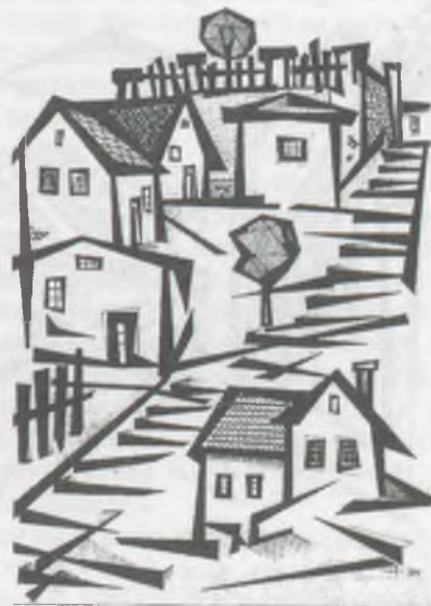
Takács Dezső tusrája, P1

Ezután a közgyűlés véget ért és baráti beszélgetések, illetve széleskörű grafika csere kezdődött el.