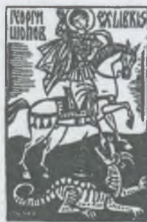
opus 504 X3 [95x65]1998