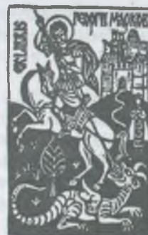
opus 503 X3 [98x65]1998