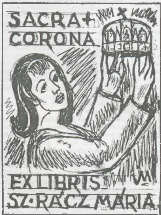
Varga Mátyás rajza, P1