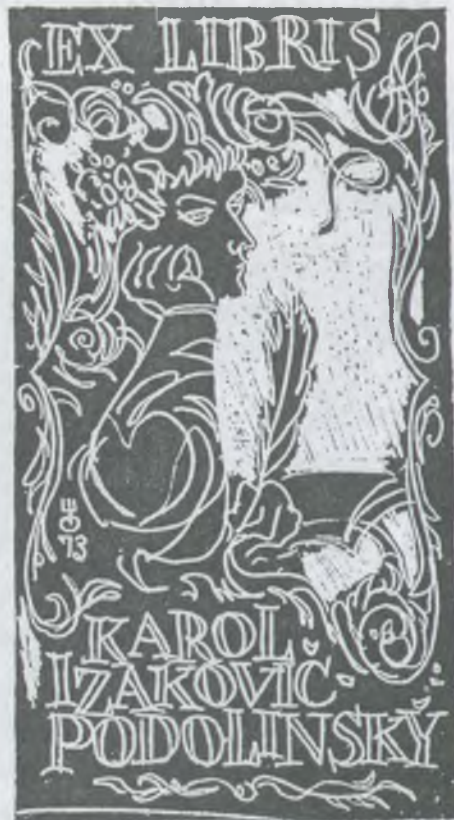
Evald Okas rézkarca, C3

Okas egész élete során úgy dolgozott, mint a szorgalmas méh. Már 1939-ben megrendezték első kiállítását. Ezt követően minden évtizedben sokszor szerepeltek művei tárlatokon hazájában és külföldön egyaránt.