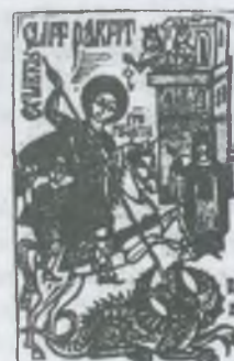
opus 359 X3 [96x63]1988