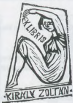
Perei Zoltán fametszete, XI