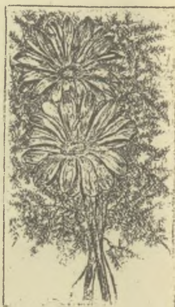
Bagarus Zoltán rézkarcai, C3