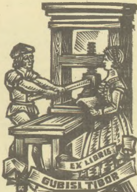
Fery Antal fametszete, X2