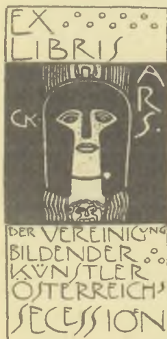
Gustav Klimt klisérajza, P1

A holland exlibris-egyesület és annak folyóirata, az EXLIBRIS WERELD 1999 decemberében a tagokhoz ajándékként juttatta el Yvonne de Vries grafikusművész mappáját, melynek egy példányát mi is megkaptuk. Az 1952-ben Amsterdamban született hölgy munkásságát 9 darab eredeti rézkarcra képviseli e kiadványban, melyek megérdemelték volna, hogy alkotójuk példányonként szignálja is azokat. A mappa szöveges részében a grafikusnő méltatása mellett közlik 110 darabból álló, szinte kizárólag C3 technikával készült kisgrafikáinak jegyzékét, az 1964-től napjainkig terjedő időről. A kiadvány érdekessége, hogy az eredeti rézkarcokat a mappához Szlovéniában nyomtatták.