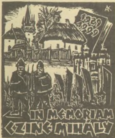
Andruskó Károly fametszete, X2

A LEX LIBRIS FRAÇAIS 212. számának külföldi lapszemléjét joggal illethetné a „szélesvásznú” jelző, ugyanis tizennégy országban megjelent, harmincnál több lappéldány tartalmának ismertetését közli, hat teljes oldalon keresztül, megütközést keltő figyelmet szentelve lapunk 1999. évi első két számának is.