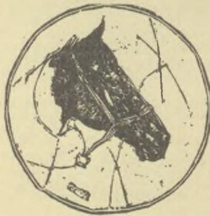
König Róbert, X3