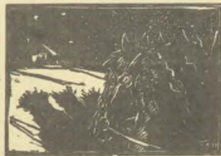
König Róbert linómetszete, X3

A terem két oldalán két üveges tárló bepillantást enged a „műhelytitkokba” is, melyekben nyers vagy már megmunkált fa- és linóleum dúcok, vésők, szerszámok, metszőkések láthatók, illusztr-