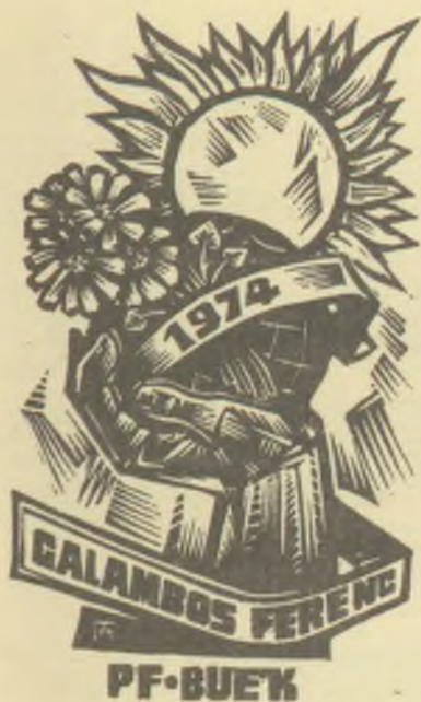
Fery Antal fametszete, X2