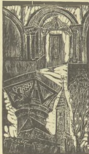
Molnár Dénes fametszete, X2