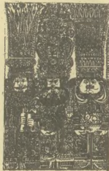
Kass János rézkarcra, C3

Figyelemreméltó cikkében a szerző igen vonzó portrét fest a művészről olyképpen, hogy idézi több kortárs róla alkotott véleményét Göncz Árpádtól Juhász Ferencen át az angol barát, Colin Banks-ig. A Szegeden 1927-ben született művész életútjának, nagysikerű sorozatainak, valamint most készülő bélyegterveinek felvázolása mellett közli a mesternek az életről, nagy szenvedéllyel végzett munkájáról, világlátásáról elhangzott vallozásait is.