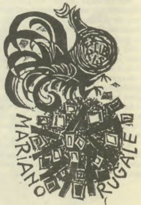
Diskay Lenke fametszetei, X1/2