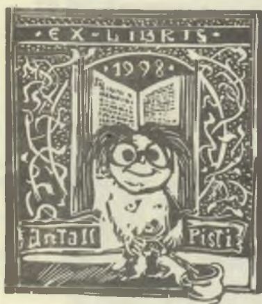
Gyulai Líviusz, X3