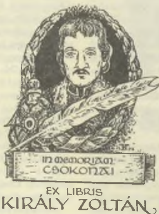
Várkonyi Károly, X2