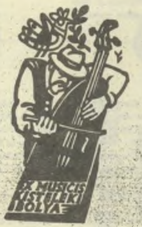
Vincze László, X3