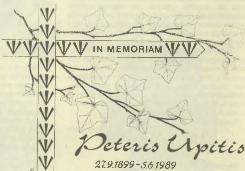
Alma Petz grafikája, P1