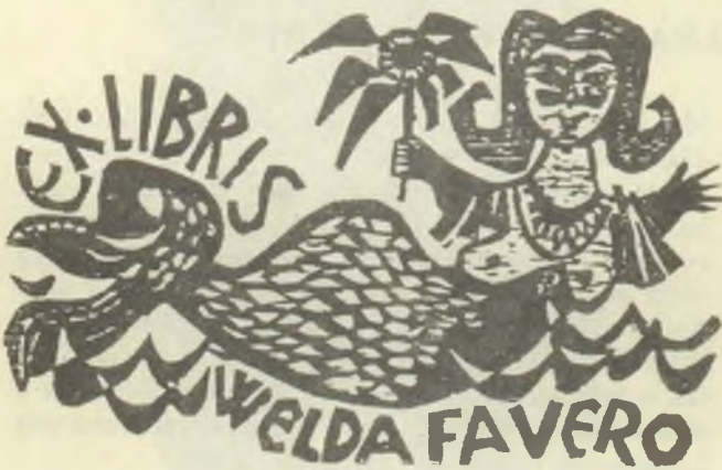
Diskay Lenke fametszete, X1