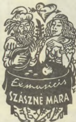
Vincze László, X3