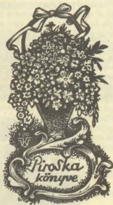
Várkonyi Károly fametszete, X2