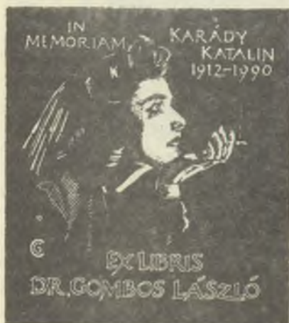
Czeglédi Gábor, X3