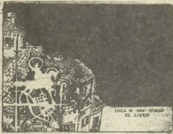
Ürmös Péter rézkarca, C3C7