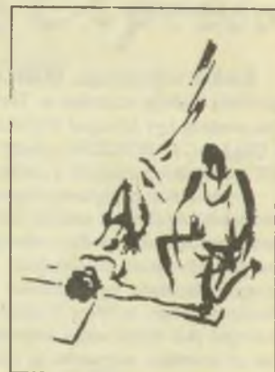
M. Kiss József ecsetrajzai