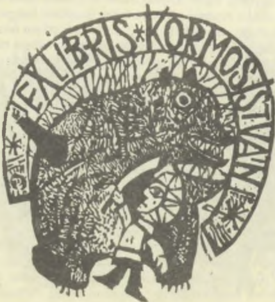
Diskay Lenke fametszetei, X1/2