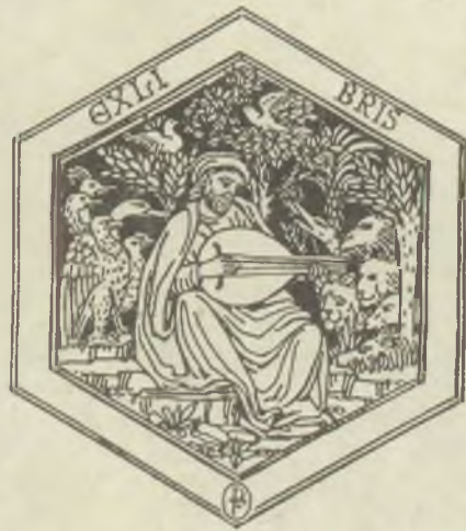
Disertori fametszete X2

SAN GIORGIO NELL'EX LIBRIS. Prima Biennale Internazionale di tematiche exlibristiche. Comunita Mantana Ingauna, Bacchetta Editore – Albegna. 189. old. (Katalógus). (Szent György témájú nemzetközi ex libris pályázat és kiállítás Villanova di Albegna könyvtárában.)