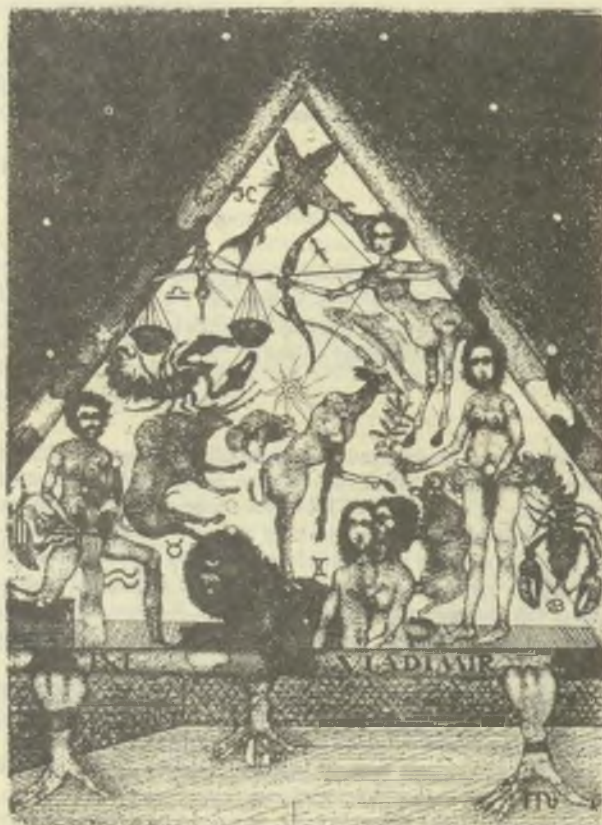
V. Gažvič litografidja

Válogatás Szalay Lajos grafikusművész (1909-1995) hagyatékából címmel nyílt meg január 15-én a Budapest Galériában az a nagyszabású tárlat, amelyen a néhány éve elhunyt, sokáig külföldön élt művész grafikai életművéből – kb. nyolcvan alkotást: egy-két olaj- és akvarell kép mellett zömmel ceruza-, toll- és tusrajzot, vagy la-