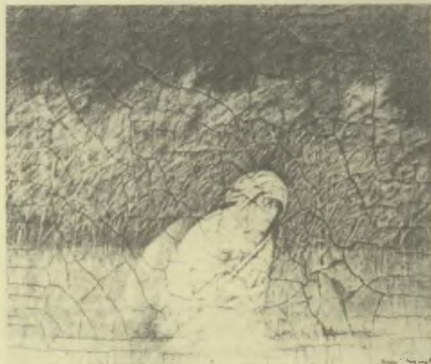
Muzsnay Ákos: Rubljov . Vöröskréta