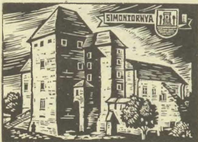
Kékesi László linómetszete, X3

megfelelően – rézmetszeteit (kisméretű alkalmi grafikákat és ex libriseket) láthatta a fürdőidény kezdetére öröndetesen megnövekedett balatoni közönség.