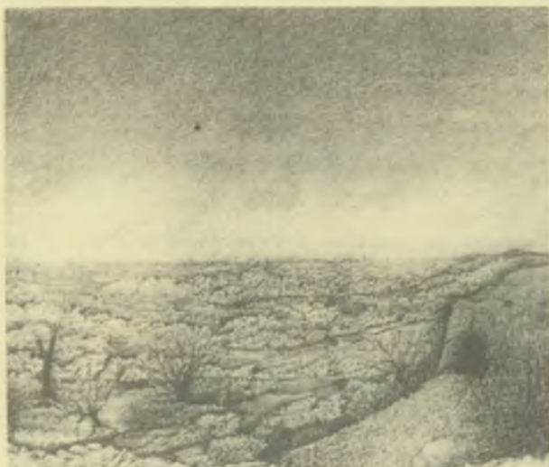
Muzsnay Ákos: Hommage à Tarkovszkij . Vöröskréta