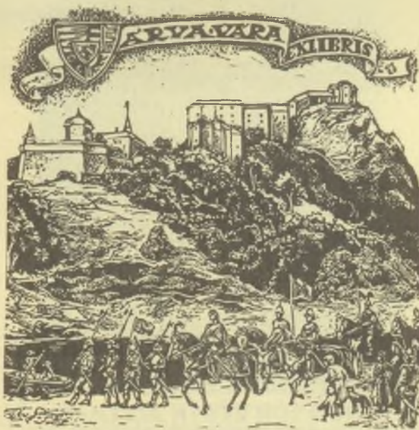
Sajtos Gyula linómetszete, X3

mutatott művek bizonyítják, hogy e műfajban mennyi szépséget és művészi értéket lehet megeleveníteni, sok örömet nyújtva mind a gyűjtőnek, mind magának a művésznek is.