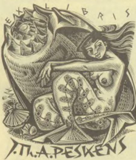
Gerard Gaudaen fametszetei, X2