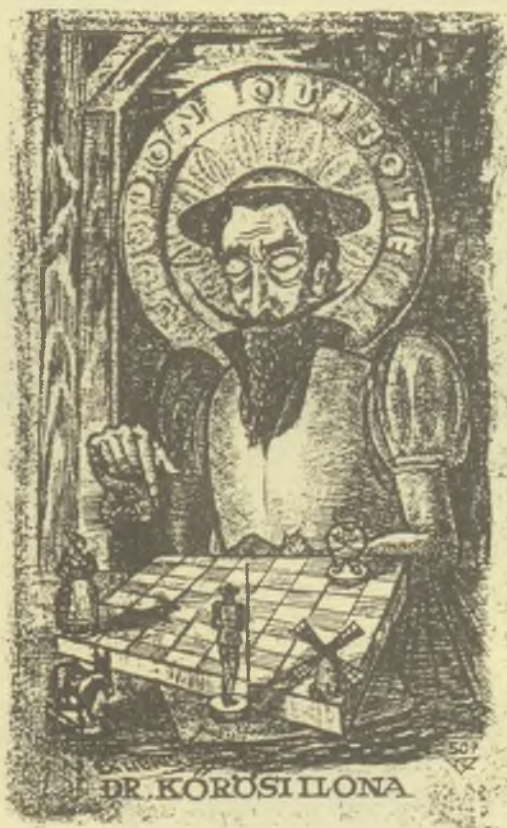
Nagy László Lázár rézkarca, C3

Az egy éves késéssel megjelent, spanyol nyelvű kiad-