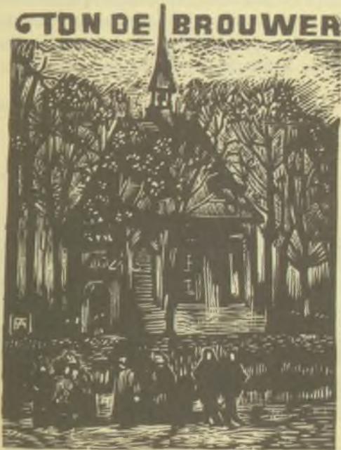
NUENEN • 1986 DOCUMENTATIE-CENTRUM