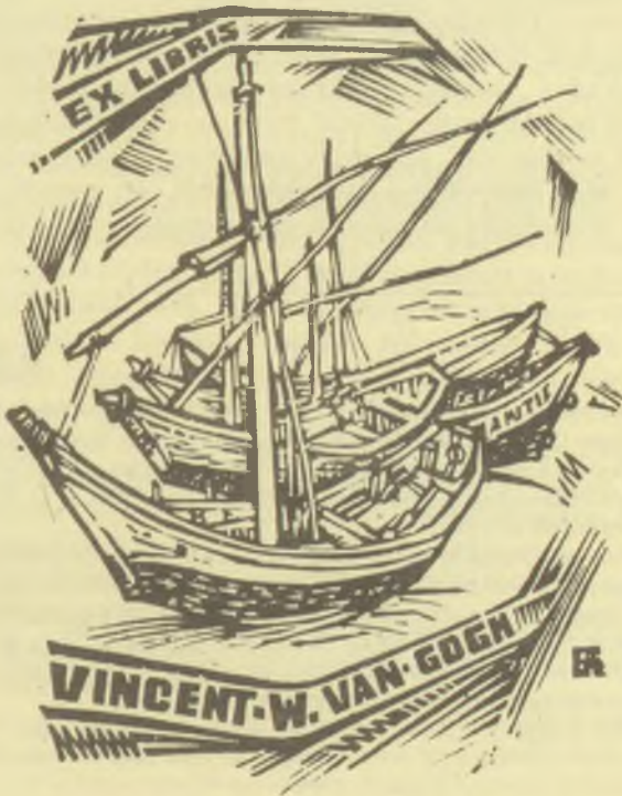
Fery Antal fametszetei, X2