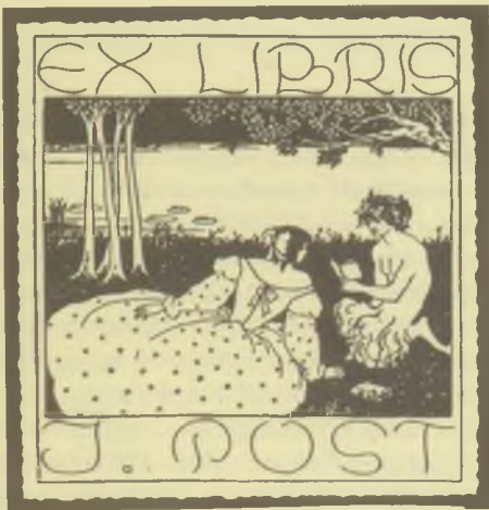
Aubrey Beardsley: Ex libris J. Post, 1895 körül