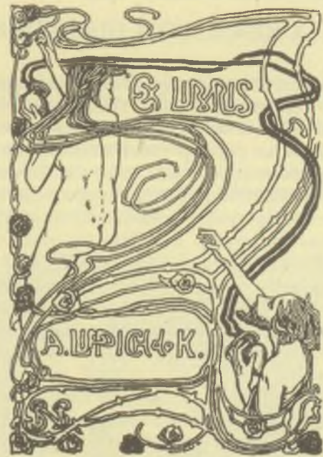
Nagy Sándor: Ex libris Lyka Károly, 1903