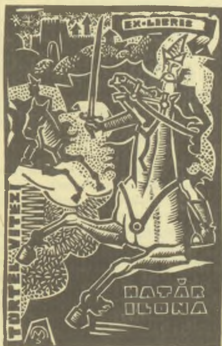
Csiby Mihály linómetszetei, X3