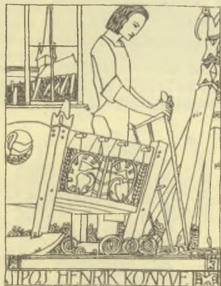
Kozma Lajos: Sipo Henrik könyve, 1908 /

nők megváltozott társadalmi és kulturális szerepét sugallva.