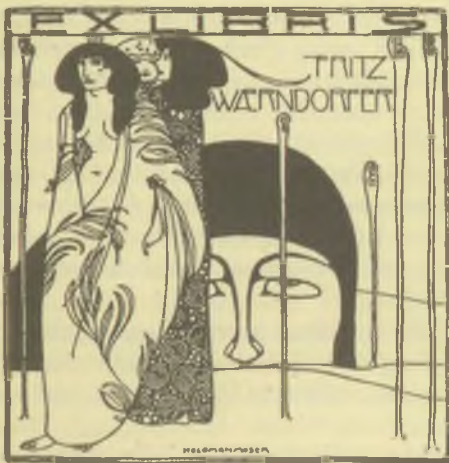
Koloman Moser: Ex libris Fritz Waerndorfer, 1903 /