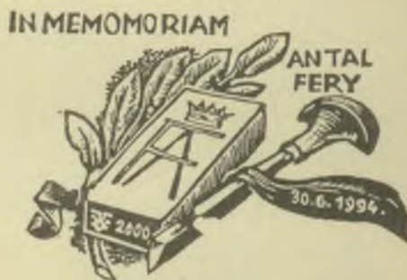
Várkonyi Károly linómetszete, X3