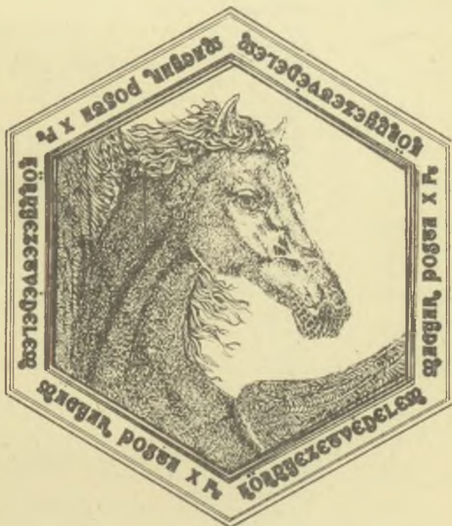
Molnár István rézkarcai, C3