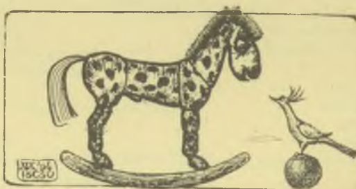
Molnár István rézkarca, C3