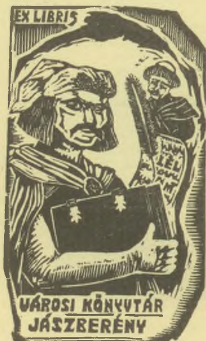
Moskál Tibor fametszete, X2