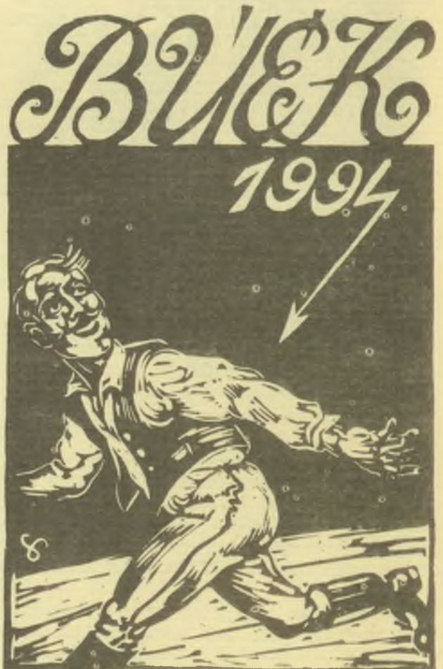
Sárosi Gyula linómetszetei, X3