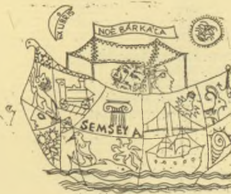
Kőhegyi Gyula rézkarcai, C3