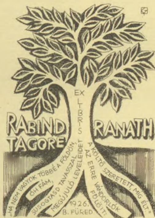
Kőhegyi Gyula rézkarca, C3