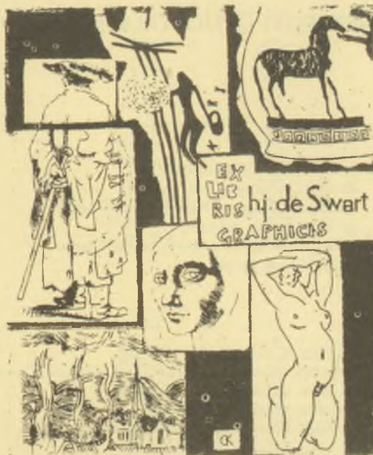
Kőhegyi Gyula, C3

Az elmondottak összefoglalásaként megállapíthatjuk, hogy amilyen megalapozott szakmai tudással,