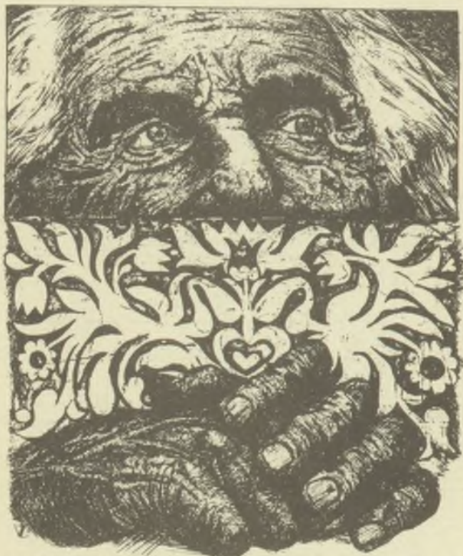
BERCSÉNYI MIKLÓS · IPARI SZAKMUNKÁSKÉPZŐ · ALKA ·