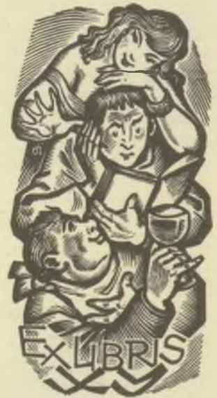
Drahos István fametszetei X2

Gyűjtő keres megvételre ex libriseket és ex libris irodalmat. Elsősorban gyűjteményeket, duplumokat, magyart, illetve bármilyen minőségűt, főképpen régi művészek metszeteit, lapjait, teljes anyagát.