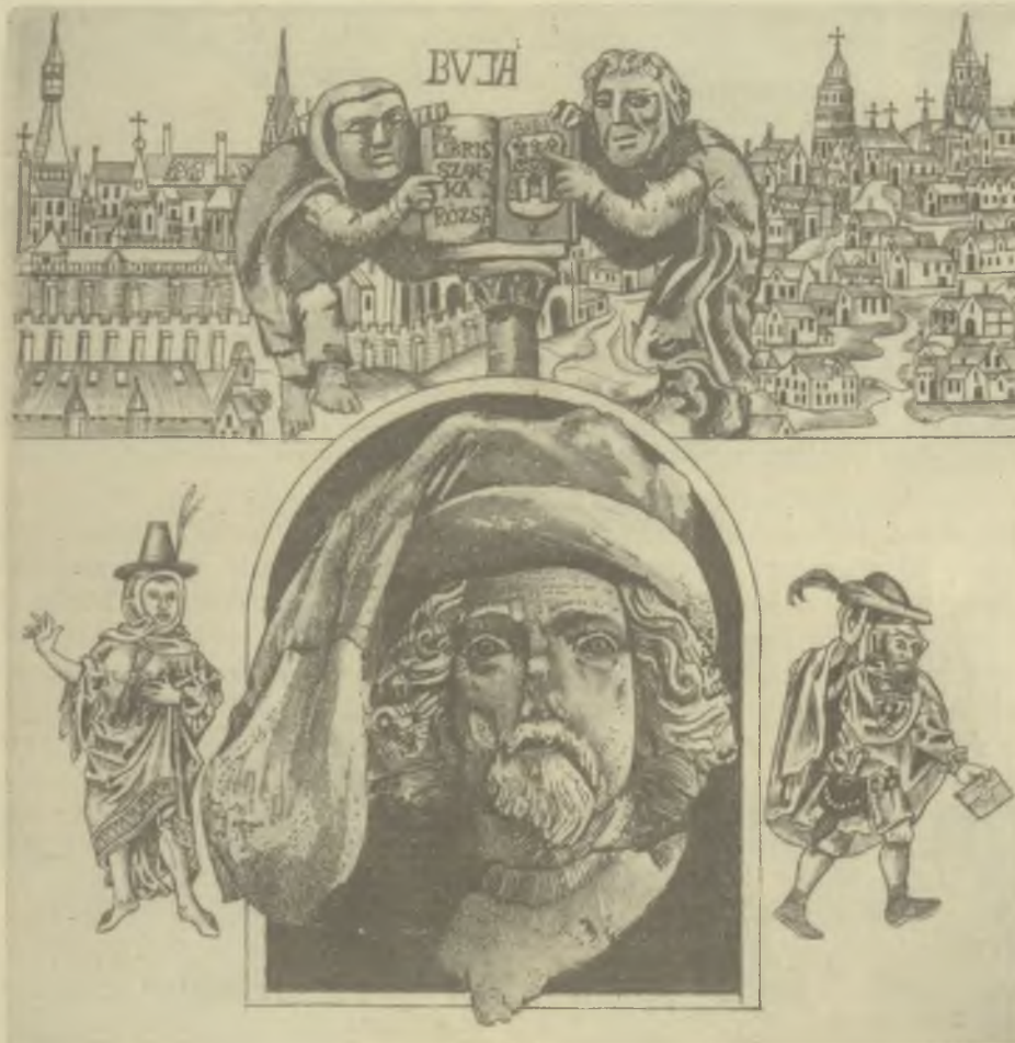
Vén Zoltán rézmetszete C 2 , C 5 , op. 283

Kiadja a „Kisgrafika Barátok Köre” Grafikagyűjtő és Művelődési Egyesület; Felelős kiadó: dr. Vida Klára ügyvezető titkár, szerkeszti: dr. Arató Antal