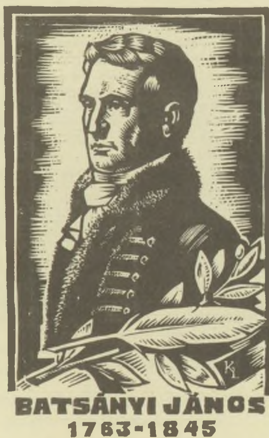
Kékesi Antal linómetszete X3