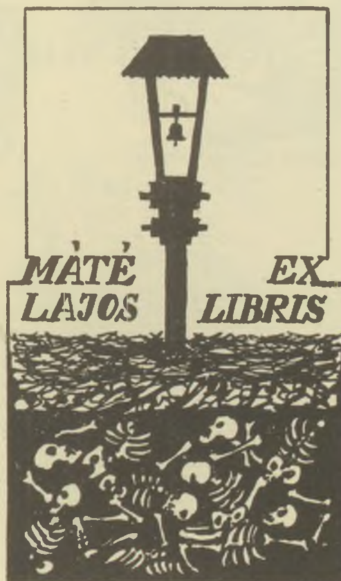
Horváth Erzsébet műanyagmetszete X6