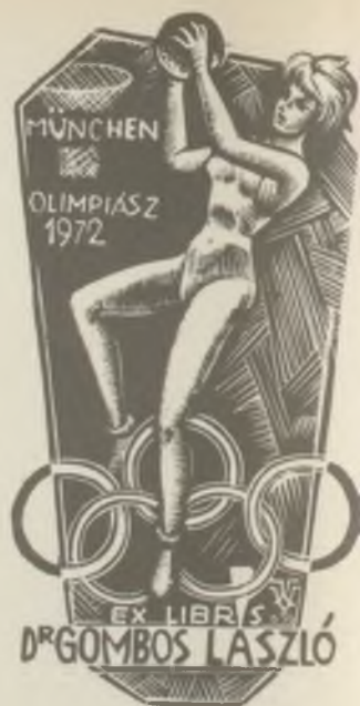
VÁRKONYI Károly fametszete X2

1972. április 25-én elhunyt Korda Béla festőművész, a kisgrafika érdemes munkása. Emlékét kegyelettel megőrizzük.