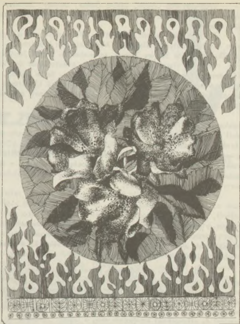
ZALA Tibor rézkarca C3