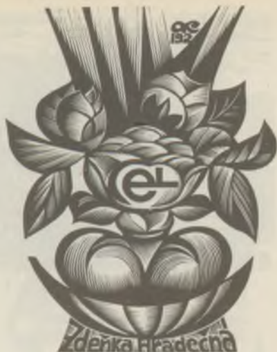
Anatolij KALASNYIKOV fametszete X2

A "Szocialista Művészetiért" 1972. évi februári száma címlapján Bordás Ferenc "In memoriam Bartók Béla" c. ex librise szerepel.