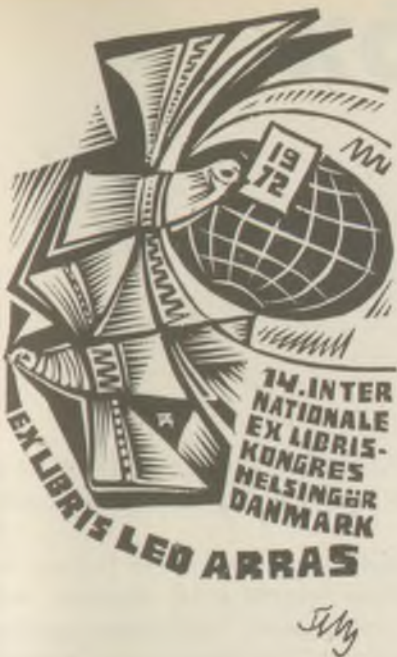
FERY Antal fametszete X2