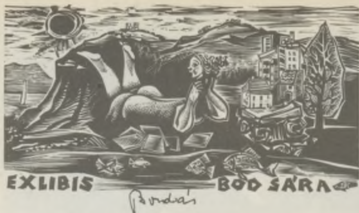
BORDÁS Ferenc fametszete X2

A kolozsvári Korunk 1972. évi 1. száma, amely a könyv évével kapcsolatban elsősorban könyvvel foglalkozó tanulmányokat közöl, gazdag illusztrációs anyagot ad az ex librisekből is. A kitűnő folyóirat e számában Stettner Béla /2/, Diskay Lenke, Buday György, Deák Ferenc alkotásai mellett régi, ismeretlen magyar művészekről származó ex librisekkel is találkozhatunk.