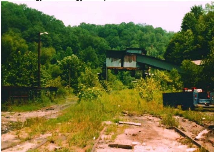
9. ábra: A Himler bánya 1981-ben

világkörüli utazásra szánta magát, viszont nem sokkal később már felröppent a hír, hogy „súlyos beteg”. 173 A volt szövetkezeti bányabárá és „salzburgi fejevadász” 1961. július 8-án egy kaliforniai kórházban hunyta le szemét. 174 Hollywoodban, a Forever Cemeteryben temették el. 175 A valamikor szebb napokat látott, kúriaszerű Himlerville-i háza 1991-ben felkerült a nevezetes történelmi épületek listájára; a település egyik utcája őrzi az alapító nevének, egy eltűnt magyar település történetének emlékét. 176