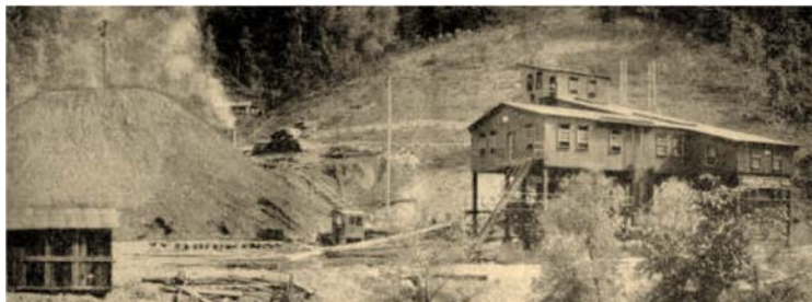
2. ábra: A Himler bányája 1922-ben