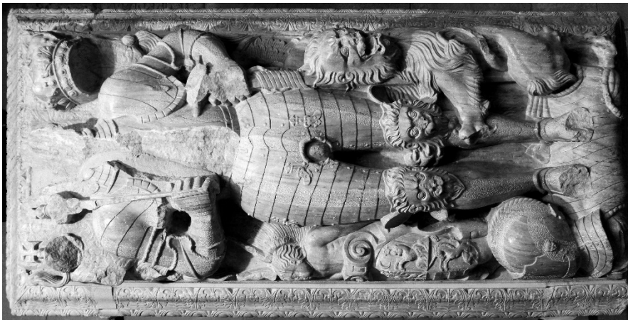
4. kép János Zsigmond síremléke

„ráadott” köpenyhez tartoznak. 18 A tumba hosszanti oldallapjain a talapzat fölé furcsán kiugró, ékként találkozó, volutákra támasztott veretdíszes, egymástól részleteikben is eltérő manierista hermák (egyikük elpusztult, tömegét a modern restaurálás jóvoltából csupán méreteit idéző kőhasáb érzékelteti) határolják a kétségtelenül fametszetes kompozíciókról felnagyított s a minta apró, kőfaragványban nehezen érvényesülő részleteihez is szemmel láthatóan hűségesen ragaszkodó, domborműben ábrázolt jeleneteket. A tumba rövid oldalait egy-egy négyszögletes, belül asztragalba, kívül manierista veretdíszbe foglalt, leveles, bogyós ágacskákból komponált téglalap alakú kártus díszíti, a keleti, láboldali közepén gyémántkváder domborodik (5. kép), csupán a nyugati oldal kártusát tartották fenn annak idején a tervezett felirat számára. 19