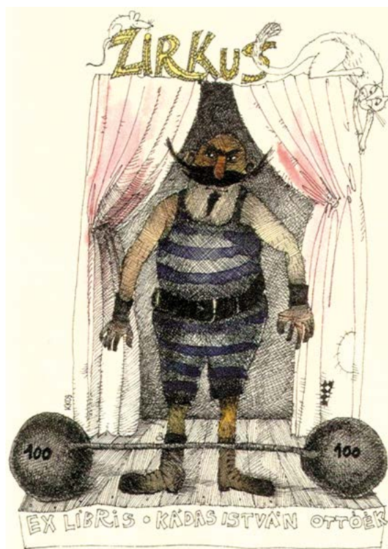
Kápolcsi Kovács Csaba, toll-ceruza-akvarell (1985), 150×100