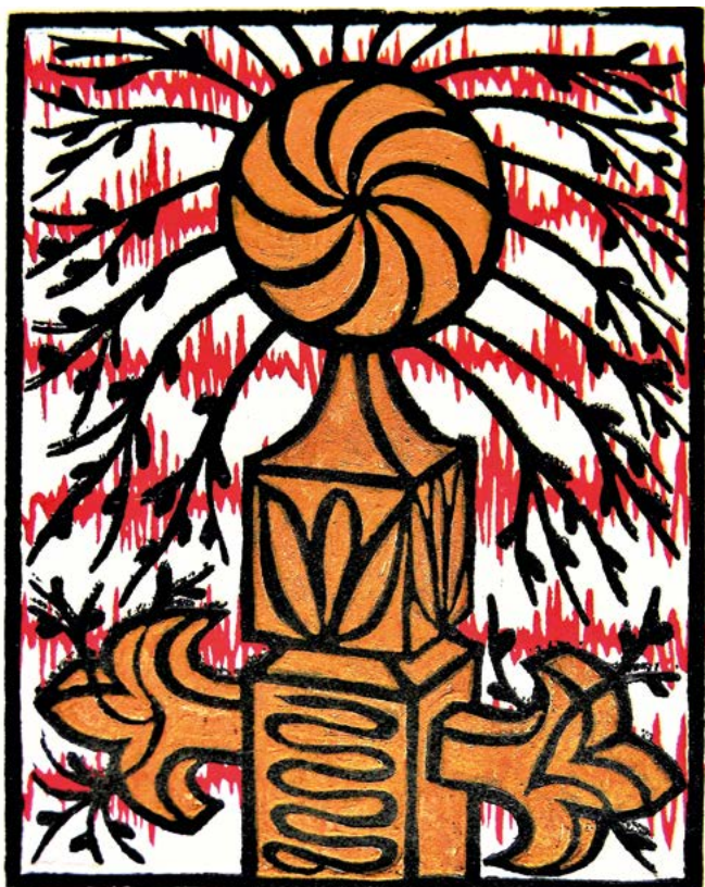
Palásti Erzsébet: Alakos fejfa II. , linó- és fametszet, X3+X1 (2001), 150 x 120

Illusztratív grafikáin belehelyezi magát a költő-író lelkébe, a vizualitás kódrendszerén át szólaltatva meg Ady Endre, József Attila, Nagy László költészetét. A 2019-ben készült Ady-émléklapok (I–X.) néhány gyöngyszemét sorolva az istenkeresés jegyében a költővel helyet foglal Az Isten balján : „Az Isten van valamiként: / Minden Gondolatnak alján. / Mindig neki harangozunk / S óh, jaj, én ott ülök a balján.” Az Isten balján ülés jelképes értelmű, az Isten jobbán ülő Jézus, a Megváltó tökéletes, teljes és befejezett életével szemben a versben beszélő be nem fejezett terveinek, el nem végzett küldetésének, lelki elhagyatottságának kifejezője. A Fedjük be a rózsát című vers alap gondolata az élet tisztelete, a csodavárás, melynek szimbóluma a megjelenített virág: „Óh, virágos Élet, be szép a csoda”. Minden embernek önmagához hűnek maradván, egyénileg is meg kell küzdenie a saját igazáért, ha hisznek benne mások, ha nem, ezt hirdeti A pócsi Mária című Ady-vers, mely Erzsébet egész életén át útmutatóul szolgált: „Ma már hiszem: nagy döntés vár reám, / Legyőzni mindent, mi ellenem támadt, / Mutatni egy példátlan életet / S nem bocsátni el az én Máriámat.”