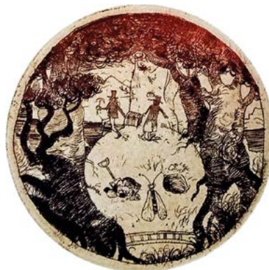
Kapolcsi Kovács Csaba: Az aranybogár, rézkarc, C3 (1994), Ø50

1994-ben San Franciscóban egy Edgar Allan Poe-illusztrációval pályáztam a miniprinttárlaton, címe: Az aranybogár . Különböző nem nagyon érdeklődöm pályázatok iránt, az alkotásban a folyamatot szeretem, a kiállításon való szereplés amolyan ráadás.