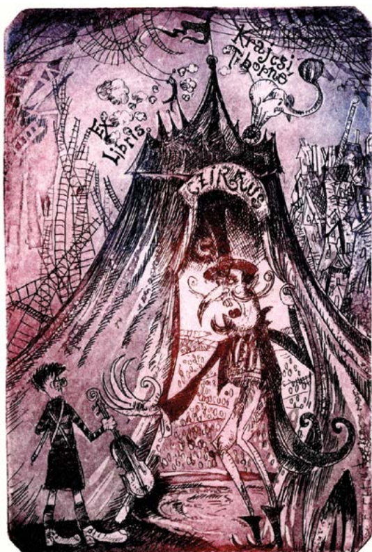
Kápolcsi Kovács Csaba rézkarca, C3 (2017), 119×80