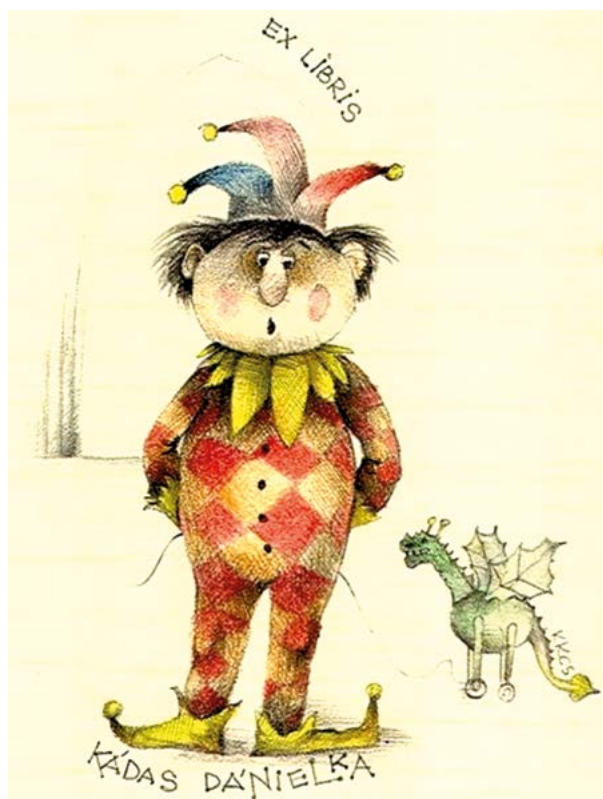
Kápolcsi Kovács Csaba, toll-ceruza-akvarell (1985), 150×100