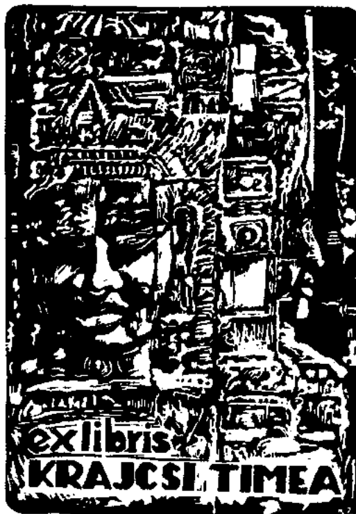
Bagarus Zoltán linómetszete, X3 (1985), 97×68

Történelmi léptékekkel ez nem nagy idő, egy ember életének is kb. csak a fele. Egy csoport esetén pedig éppen elég ahhoz, hogy az elmúlt idő fontosabb eseményeit felidézzük, értékeljük. Tesszük ezt azok helyett is, akik ma már nem lehetnek közöttünk, alkotóink és alapítóink fele már csak gyűjteményével képviseli a kört. Nem törekedhetünk a teljességre, és a meg-