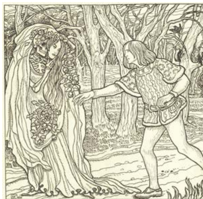
Körösfői-Kriesch Aladár grafikája: Ember a halál nyomában (1905)