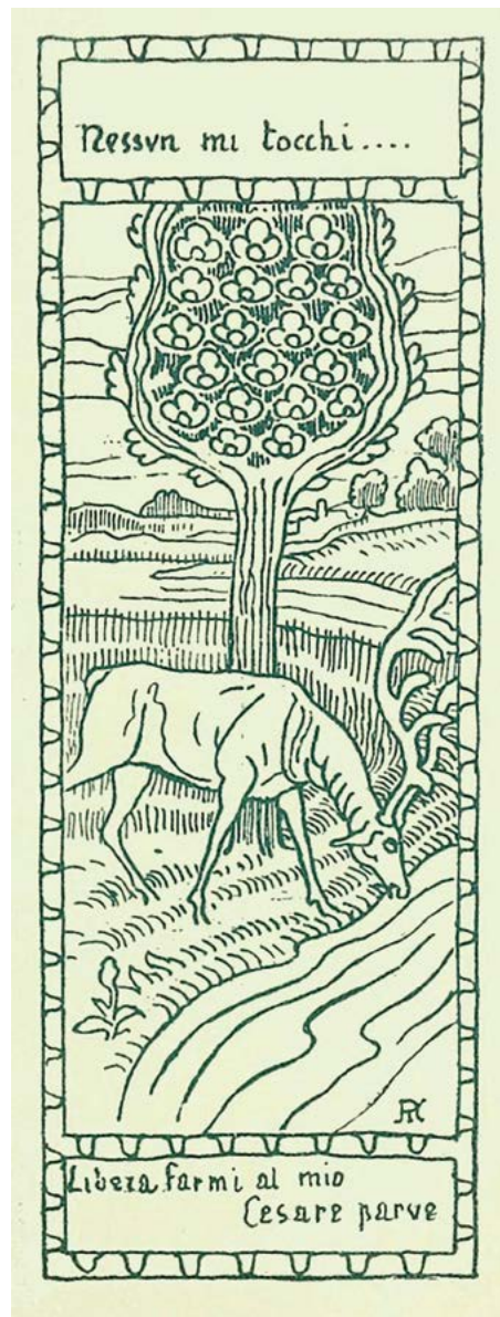
Körösfői-Kriesch Aladár grafikája (1903 k.), 160×65