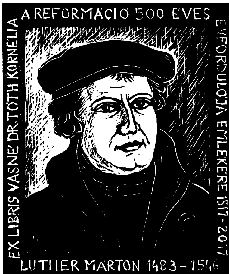
Brittich Erzsébet linómetszete, X3 (2016), 124×104