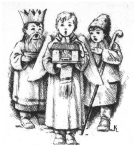
Kékesi László rézkarca, C3, op. 8 (1959), 60×55