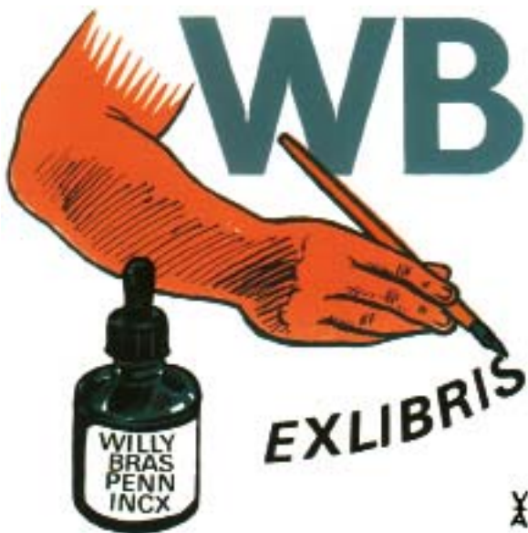
Antoon Vermeulen (B) grafikája, S3 (1986), 75×75