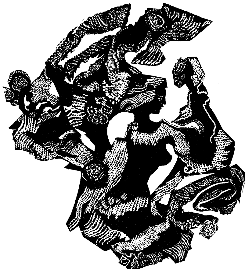
Kopasz Márta linómetszete, X3, 150×135

Köszönet azoknak, akik a tulajdonukban lévő, vagy a tudomásukra jutott, a kiadványból még hiányzó Kopasz Márta művekre felhívták a figyelmünket és segítették az összeállítást.