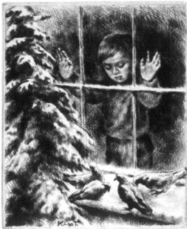
Kiss Terézia hidegtű grafikája (C4), 110×90

Áldott szép karácsonyt és boldog új évet kívánunk minden kedves olvasónknak!