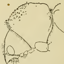
1. ábra, Psoa sanguinea Giorna és 2. ábra Bostrychus capucinus Lim. feje és előtora oldalról nézve. (Lesne).