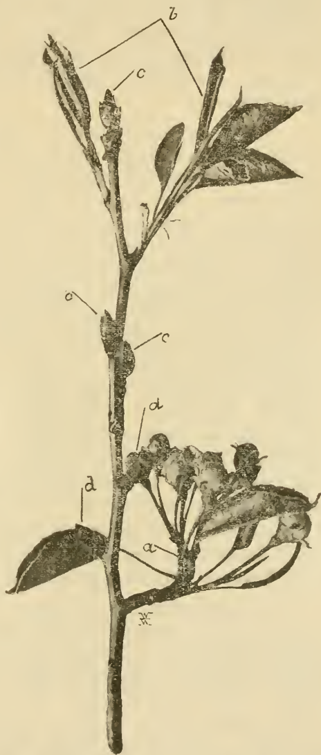
3. ábra. Körtefaág egy kifakadt termőrüggyel (a), két kifakadt levélrüggyel (b), három tönkretett idei termőrüggyel (c) és tavaly tönkretett két rügy helye az elhalt termőnyársakon (d). (1901. április 20-án).

az alapjukon gyűrűalakban elszáradnak és nem bontakozik ki belőlük a gyöngye tavaszi lomb (1. ábra I). Hogy a fertőzött rügy összeaszás után az alapján gyűrű alakban összefűződik, az onnan van, mert az alsó rügypikkelyek alapi fele nem olyan barna, kemény, mint csúcsi felök, hanem sárgás-zöld színű puha s így az alsó rügypikkelyek alapjukon jobban összeasznak, mint a hegyükön. A fertőzött rügyeket e mellett, hogyha a lárvák már jól ki vannak fejlődve s már a rügy alapjához közel rágódnak, az erősebb szél le is veri a fáról vagy később magától is lehull (3. ábra d); egyik-másik fertőzött rügy azonban egykét évig is rajta marad a fán. De a fertőzött rügyek az egészségesek közt még sem olyan szembetűnők, mint az almavirág-ormányos lárvaút tartalmazó almabimbók az ép rózsás-fehér almavirágok közt, bár a kártétel, mint említettem, aránylag sokkal tetemesebb lehet e mellett. A teljesen kifejlődött lárva (1. ábra D és E) hasonló az almavirág-ormányos lárvájához, ennél azonban valamilyen zömökebb, vastagabb, de kurtább, 5 mm. hosszú, a mi összefüggésben áll avval a körülménnyel, hogy lakása, t. i. a rügy belseje jóval szűkebb az almavirág-ormányosénál (virág). A larva ezenkívül a rügy