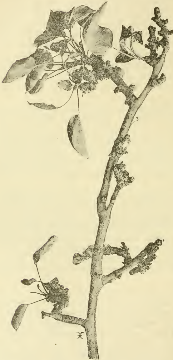
2. ábra. A körterügyfűró bogár kártételének évek hosszú során át kitett göröcsös körtefaág az elhalt termőnyársakkal, kevés lombbal, virág nélkül. (1901. május 3-án).

szik. Az olyan körtefán, a mely évek hosszú során át ki van téve a körterügyfűró bogár kártételének, rendszeren kevés a lomb, még