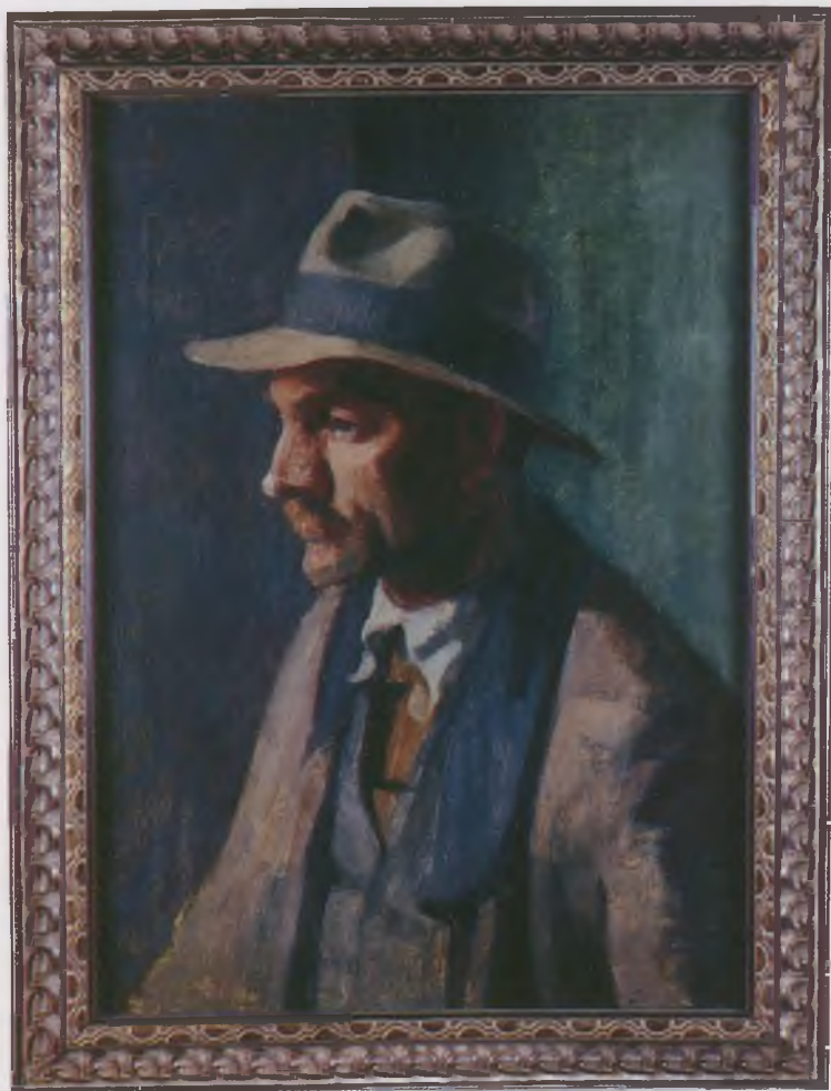
József Attila – Berény Róbert (1887–1953), 1930 körül. Olaj, vászon. MNMTKCS