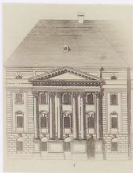
Debrecen, a református kollégium. Rézmetszet, 19. század eleje.

(Nagyszalonta, 1755. december 21.–Hajdúhadház, 1801. április 6.)