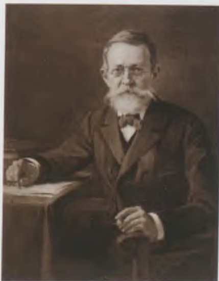
Szinnyei József – Túry Gyula (1866–1932) festménye után készült fénynyomat. MNMTKCS

Legismertebb és legtöbbet forgatott munkája a Magyar írók élete és munkái című, amely 1891 és 1914 között jelent meg. A tizennégy vaskos kötetben Szinnyei arra vállalkozott, hogy a 19. század végéig élt valamennyi jelentős író, szakíró rövid biográfiáját és műveinek, cikkeinek jegyzékét egy egységes életrajzi lexikonban közreadja. Egymaga készítette el mintegy 30 ezer személy bio-bibliográfiáját. Emellett munkatársa volt a Pallas Nagy Lexikon ának, a főrangú családok genealógiáját összefoglaló 1888-as kézikönyvnek, és több száz értékes szakcikke is megjelent. Az egyik legszorgalmasabb magyar szakírónak tartották, aki nem véletlenül érdemelte ki a „gőzhangya” becenevet. Teljes életművét első alkalommal a Nemzeti Könyvtár bicentenáriumi tiszteletére jelentették meg.