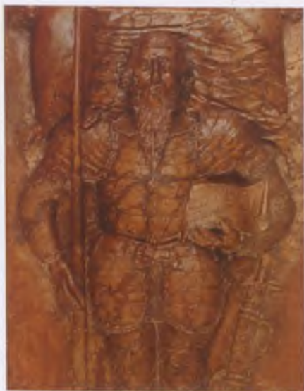
Dobó István vörösmárvány síremléke (részlet)