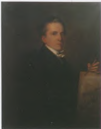
Pollack Mihály – Than Mór (1828–1899). Olaj, vászon, 1880-as évek. MNMFKCS

(Bécs, 1773. augusztus 30.–Pest, 1855. január 5.)