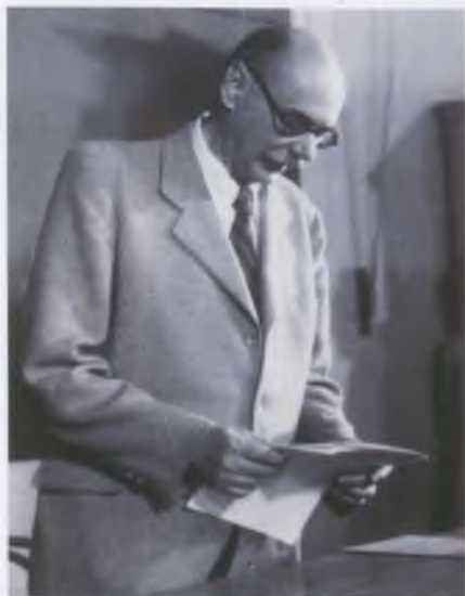
Szekfű Gyula – MAFIRT felvétel, 1945. MNM Fotótár

(Székesfehérvár, 1883. május 23.–Budapest, 1955. június 28.)