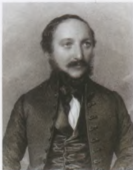
Vörösmarty Mihály – Barabás Miklós (1818–1898) acélmetszete, 1844. MNMTKCS

(Pusztanyék [ma: Kápolnásnyék], 1800. december 1.–Pest, 1855. november 19.)