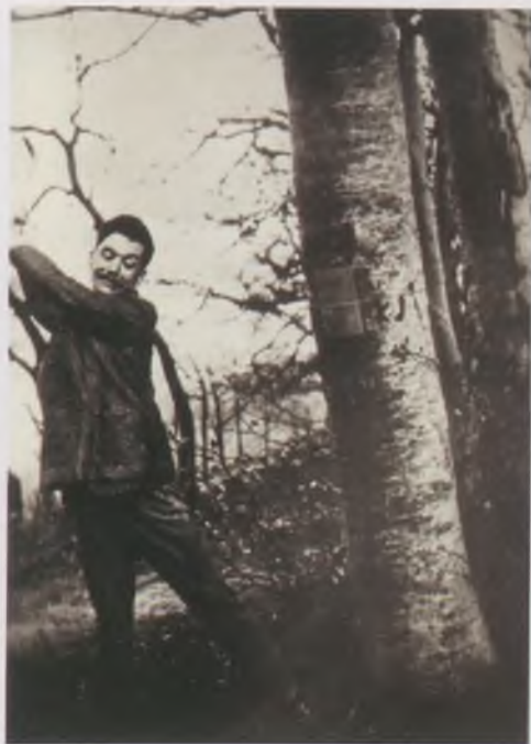
József Attila