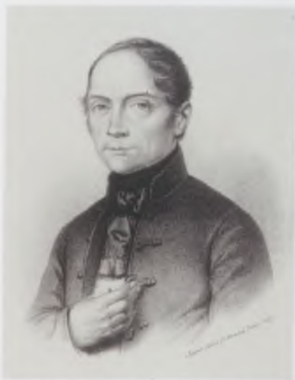
Petényi Salamon János – Rohn Alajos és Grund Vilmos litográfiája, 1860. MNMTKCS

Születésének bicentenáriumára összefoglaló kötet jelent meg róla, amely legértékesebb írásait és műveinek jegyzékét is tartalmazza.