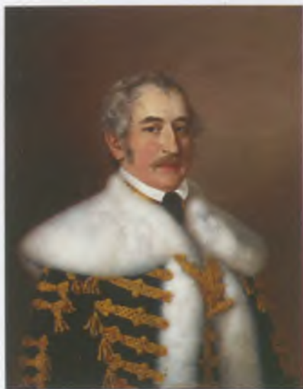
Teleki József – Barabás Miklós (1810–1896). Olaj, vízszon, 1836.

(Pest, 1790. október 24.–Pest, 1855. február 15.)