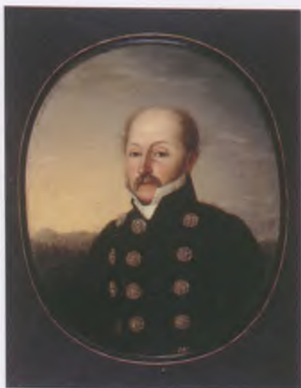
Kisfaludy Károly – Olaj, vászon, 1920-as évek. MNMTKCS

(Tét, 1788. február 5.–Pest, 1830. november 21.)