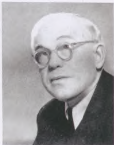
Fejér Lipót – Fotográfia, 1940-es évek.

(Pécs, 1880. február 9.–Budapest, 1959. október 15.)