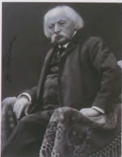
Goldmark Károly 1910 körül.

Goldmark a Monarchia egyik legnépszerűbb komponistája volt, de nem tartozott a késő romantikus zene egyik táborához sem: jó barátságban állt Brahmszal, miközben egyike volt a bécsi Wagner Társaság alapítóinak, és zenekritikusként Bécsben először ő tört lándzsát Wagner mellett. Zenetörténeti jelentőségéhez hozzájárul, hogy Sibelius tanára volt, és az ifjú Schönberget is pártfogolta. Halála után a Monarchiával együtt széthullott az a kultúra is, amelynek nyelvét Goldmark zenéje a legmagasabb szinten beszélte. Műveinek népszerűsége megmaradt a két világháború között is, de „bizonytalan hovatartozása” és a bartóki nemzedék elsöprő fölénye, új értékrendje elhomályosította életművének értékeit. Korunkra vár, hogy ezeket újra felfedezzük a magunk számára.