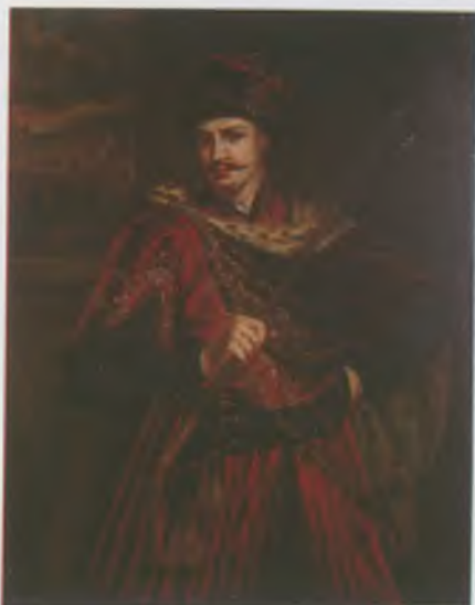
Thököly Imre – Lord Bath Longleat Castle-beli, 17. századi festményének másolata. MNMTKCS

Thökölyt a visszafoglaló háborút lezáró karlócai béke értelmében az Oszmán Birodalomba száműzték, ahol a Márvány-tenger keleti partján lévő Nikomédiában telepedett le. Felesége 1703-ban halt meg. Thököly még megérhette a nevelt fiának, II. Rákóczi Ferencnek vezetésével induló szabadságharc kezdetét, de hamarosan meghalt. Földi maradványait 1906-ban hozták haza, és Késmárkon helyezték végső nyughelyére.