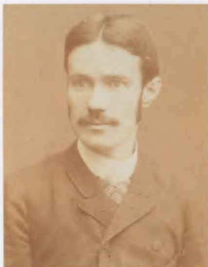
Reviczky Gyula, 1886 körül.

(Vitkóc, 1855. április 9.–Budapest, 1889. július 11.)