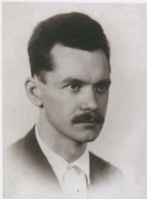
József Attila