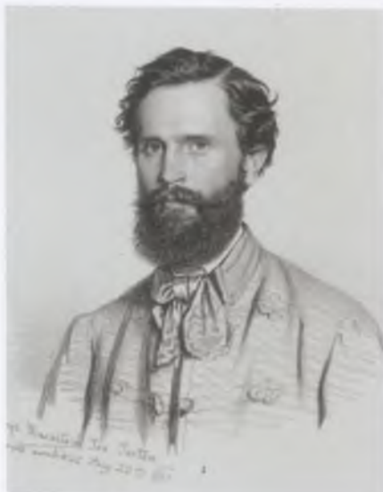
Orlai Petrich Soma – Marastoni József (1834–1895) litográfiaja, 1861. MNMTKCS

(Mezőberény, 1822. október 22.–Budapest, 1880. június 6.)