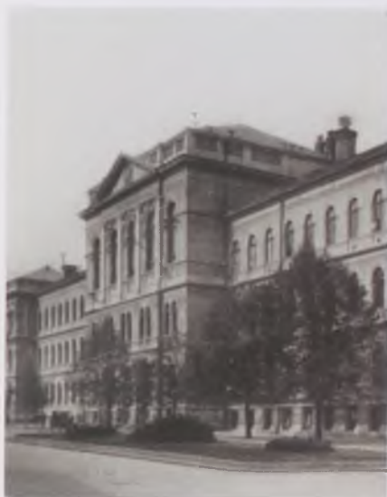
A kolozsvári Tudományegyetem főépülete.

Egyetemi kortársai is kiváló tudósok voltak, köztük említjük Fejér Lipót, Riesz Frigyes és Haar Alfréd nevét.