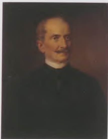
Mikó Imre – Barabás Miklós (1818–1898). Olaj, vászon, 1874. MNMTKCS

Mikó Imre gróf a magyar nemzeti kultúra fejlesztésében betöltött szerepe által rászolgált arra, hogy Erdély Széchenyi-jének nevezzük és a magyar hagyományrendszerben az őt megillető helyet elfoglalja.