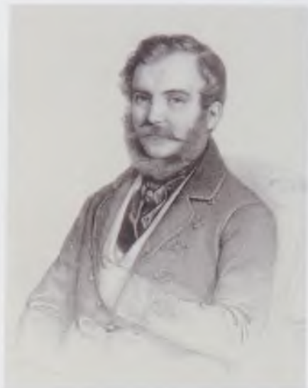
Toldy Ferenc – Barabás Miklós (1810–1898) litográfia, 1845. MNMTKCS

Nem először nézünk szembe ezekkel a kérdésekkel, hiszen például Kuncz Aladár és Wéber Antal kismonográfiája mellett folyóiratainkban számos tanulmány foglalkozott munkásságával, az utóbbi évtizedekben kritikátörténeti korszakmonográfiák szenteltek neki fejezeteket, s e sorok írója tollából is megjelent az évforduló előestéjén egy Toldy Ferencről szóló könyv. Mindez azonban legföljebb előkészületként segítheti mai szempontú közös számvetésünket „irodalomtörténetünk atyjának” örökségével.