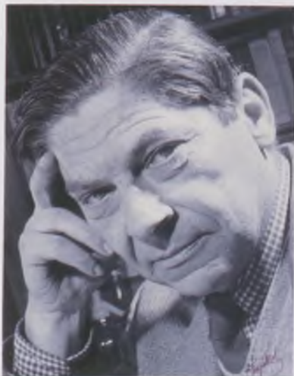
Arthur Koestler – Forgács Károly felvétele, 1960 körül. MNM Fotótár

Koestler szépirói életműve döntően önéletrajzi ihletésű. Kétkötetes önéletrajza a műfaj 20. századi klasszikus darabja ( Nyilvessző a végtelenbe , 1952, A láthatatlan írás , 1954; magyarul 1996, 1997). Az ötvenes évektől érdeklődése egyre inkább a természet- és társadalomtudományok nagy vitákat kiváltó kérdéseire irányult, élete végén a paratudomány lehetőségei felé tájékozódott. E könyvei közül az Alvajárók (1959; 1996) az ókori és újkori kozmológiai gondolkodás alakulását áttekintő tudománytörténeti alapmű, A tizenharmadik törzs (1976; 1990) pedig a kelet-európai zsidóság kazár eredete mellett érvelő kultúrtörténeti tanulmány.