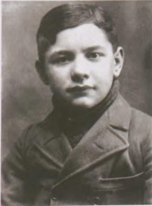
József Attila

(Budapest, 1905. április 11.–Balatonszárszó, 1937. december 3.)