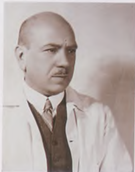
Hajós Alfréd – Barabásné Földiák Ibi felvétele, 1929 körül. MNM Fotótár

Hajóst fél évszázados építésztervezői pályafutásáért műegyetemi aranydiplomával jutalmazták 1949-ben. 1953-ban a Sportérdemérem arany fokozatával és a NOB Olimpiai Diplomájával tüntették ki. 1966-ban a Hall of Fame (Úszósport Hírességei Csarnoka) tagjává választották. 1955-ben jelent meg Így lettem olimpiai bajnok című önéletrása. Budapesti, Báthory u. 5. sz. alatti lakásában (a lakóház tervei alapján épült 1905-ben) létrehozták hazánk első sportmúzeumát, amely alapjául szolgált az 1977-ben végleges helyén kialakított Testnevelési és Sportmúzeum törzsállományának. 1976-tól nevét viseli a Nemzeti Sportuszoda.