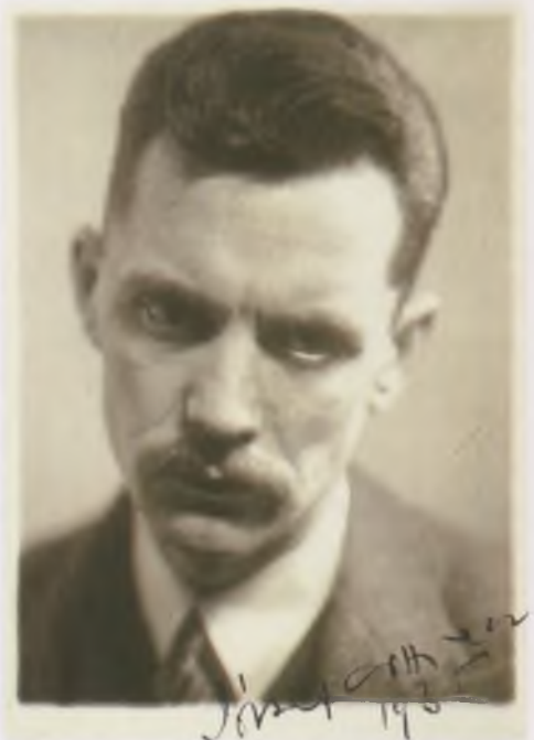
József Attila

feleségül kérte, s antik mintákat követő, himnikus versekkel udvarolt neki – de a Flóra-ciklus már a reménytelenség bizonyosságával volt terhes. A tévképzeteibe belebonyolódó, kóros kisebbréndűségi érzéstől szenvedő költő júliusban újra szanatóriumba került – de ott is alkotott: az utolsó percig bizonyítva, hogy nem „őrült”, nem skizofrén, noha a korabeli orvostudomány szintjén erre a diagnózisra alapozták a kezelését. A Költőnk és Kora , a szublimáció tudatosításának formai asszociációk alapján született mesterkölteménye, már az Anyához, a „nagy Ūrhöz” készülő lélek rezignált önvallomása volt.