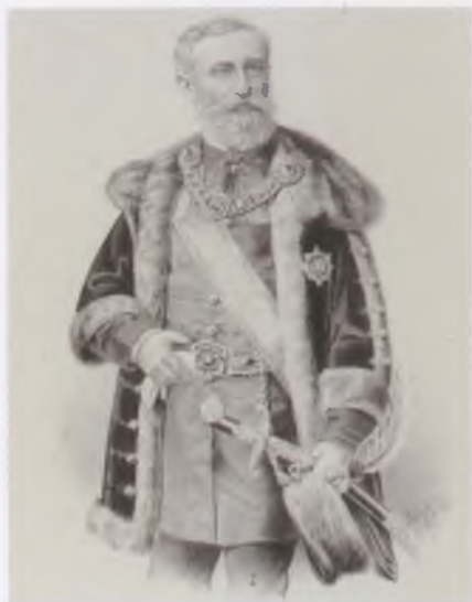
Tisza Kálmán – Suhajdy György litográfája, 1885. MNMTKCS

(Geszt, 1830. december 16.–Budapest, 1902. március 23.)