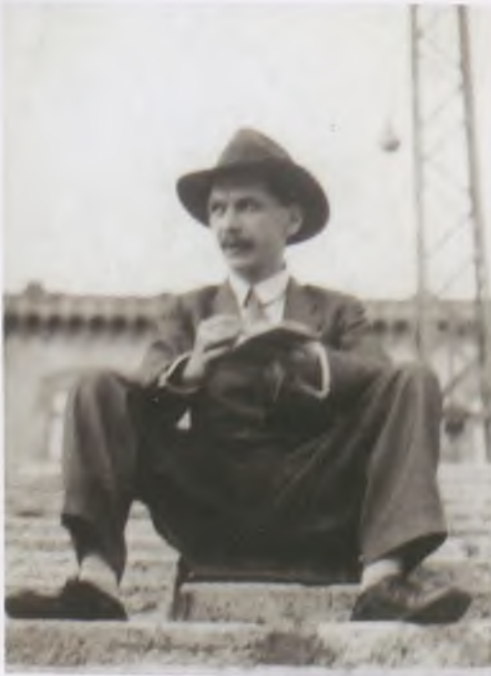
József Attila – Ismeretlen felvétele, 1935 körül. PIM