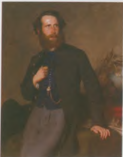
Rosti Pál – Székely Bertalan (1835–1910). Olaj, vászon, 1862–64.

Az 1848–49-es szabadságharcban a Károlyi-huszárezred katonájaként küzdött. Világos után emigrálni kényszerült. Münchenben természettudományokkal, elsősorban kémiai tanulmányokkal foglalkozott. Párizsban megtanulta az akkoriban még ritkaság számba menő fényképezés technikáját, majd földrajzi és néprajzi stúdiumokat folytatott. 1856. augusztus 4-én hajóval utazott az „Újvilág”-ba: bejárta az Amerikai Egyesült Államokat, Kanadát, Mexikót, Venezuelát, Kubát és az Antillák számos szigetét. Tapasztalatairól, élményeiről gyönyörűen illusztrált Úti emlékezetek Amerikából című könyvében számolt be. Műve előszavában így írt: „Nézetem szerint a földismeret terjesztésére alig van hathatósabb eszköz, mintha jellemző, hű rajzok által a különböző éghajlatok egyes tájairól, városairól, építményekről, növényekről s a t. világos képeket nyújtunk. Vándorlásom egyik fő feladatául tekintém e szerint az ily nemű képeknek a fényrajz útján való előállítását.”