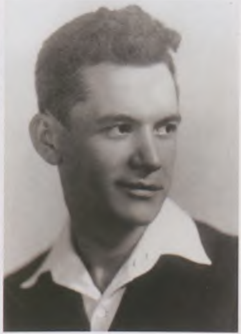
József Attila

Akár meg is fordíthatnánk a két dátumot: József Attila akkor született meg országosan elismert költőként, amikor Balatonszárszón kiállították róla a hivatalos halotti bizonyítványt. A kor- és pályatársak többsége csak a bulvárszenzációként tálalt halálhír után döbbsent rá, milyen kivételes életművet alkotott ez a mindaddig csak „jó költő”-ként számon tartott, zavarba ejtően sokféle hangon megszólaló – ezért gyakran félreértett –, posztumusz fölfedezett zseni, akinek életútját kisgyermekkorától váratlan veszteségek, lelki traumák, különös fordulatok szegélyezték –, s aki egyéni szenvedéseiből egyetemes érvényű költészetet teremtett.