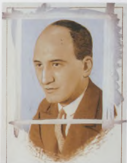
Rejtő Jenő

Az ötvenes években egyáltalán nem adták ki műveit, a hatvanas években viszont a Magvető Kiadó Albatrosz-sorozatának köteteiként száz-százötvenezer példányban jelentek meg. Korábban kiadatlan szövegeit is publikálták, köztük a detektívtörténet kellékeit túlzásig fokozó Vesztetgár a Grand Hotelben című remekművet. Rejtő Jenő a hetvenes években már a legismertebb öt magyar szerző közé tartozott.