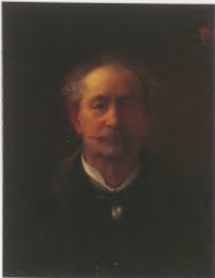
Madarász Viktor – Önarckép. Olaj, vászon, 1910. MNMTKCS

(Csetnek, 1830. december 14.–Budapest, 1917. január 10.)