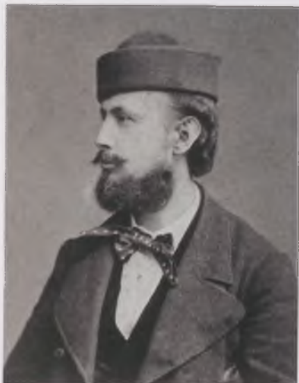
Divald Károly – Őnarckép, 1860-as évek. KÖH Fotótár

A kiadó első nyilvános sikerét A képzőművészet remekei című díszes kiállítású album hozta meg. A képek a Magas Tátrából című sorozatával pedig Divald a topográfiai fotográfia – egy időben a műfaj európai és amerikai kibontakozásával – első magyarországi képviselője lett. A szabadban való fényképezés nagy apparátust (a legnagyobb képformátumot és a legnagyobb részletgazdagságot adó üvegtáblákat) igényelt, ezért Divald 15-20 tagból álló segítő csapattal dolgozott expedíciói során. Első, szakmai sikert hozó munkája 1873-ban a Kárpátok vándorútjainak föltérképezése és a Magas-Tátra kartográfiai és tudományos fölmérése volt. Az 1880-as években részt vett a Dobsinai- és az Aggteleki-cseppkőbarlang fölfedezésében is. Divald Károly művészi ösztönrel készített tájkép-fotográfiai ma is forrásértékű dokumentumok.