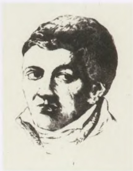
Gyarmathi Sámuel – Gémes Péter (1951–) rézkarca, 1984. Semmelweis Orvostörténeti Múzeum

(Kolozsvár, 1751. július 15.–Kolozsvár, 1830. március 4.)