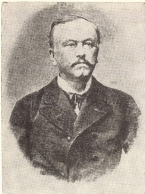
Nagy Imre 1822—1894

Nagy Imre írja a szerkesztőnek: „A »Századok« igen kielégítenek környékünkben mindenkit, megint szerettem egy új tagot, azonban előfizetési az az aláírási íveim elfogytak, küldj nehányat.”