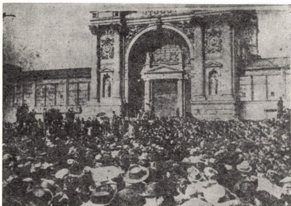
Az iparcsarnoki nagygyűlés. 1917. november 25.

„Budapestnek és környékének munkásai s velük együtt Budapest egész népe testvéri üdvözlét küldi az orosz forradalmároknak, akik bátor szívvel, erős elmével és kemény kézzel vezetik ki az emberiséget a háború poklából. Mi mindannyian, akik itt összegyűltünk s az egész dolgozó Magyarország, el vagyunk határozva arra, hogy az orosz forradalmárokat a béke megszerzésére irányuló hősi harcukban támogatni fogjuk, és hogy minden erőnkkel küzdeni fogunk azért is, hogy egyik osztálynak a másik által való kizsákmányoltatása és egyik nemzetnek a másik által való elnyomatása a mi országunkban is megszűnjék!”