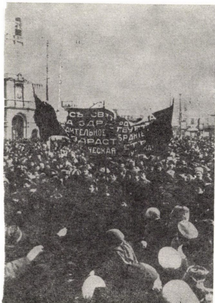
Moszkva. Tüntetés a Vörös téren