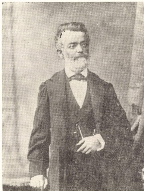
Szabó Károly 1824—1890

„A cikk honoráriumát annak idejében, ha t. i. utalványozva lesz, kérem postán leküldeni. Megfáradtam érte Isten igazában; nem kerestem a munka könnyebb végét” — írja Szabó Károly.