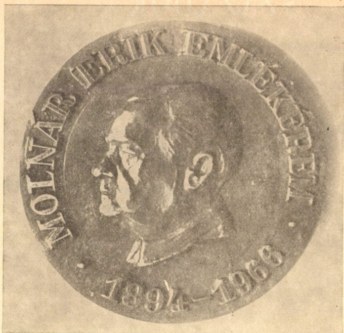
A MAGYAR TÖRTÉNELMI TÁRSULAT ÜNNEPI KÖZGYŰLÉSÉN KIOSZTOTT MOLNÁR ERIK EMLÉKÉREM