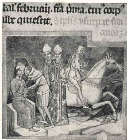
7. kép. A korona elrablása (61 a lap)