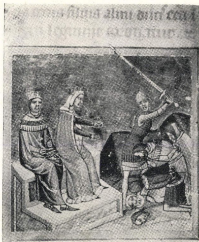
5. kép. Az aradi kivégzés (57a lap)