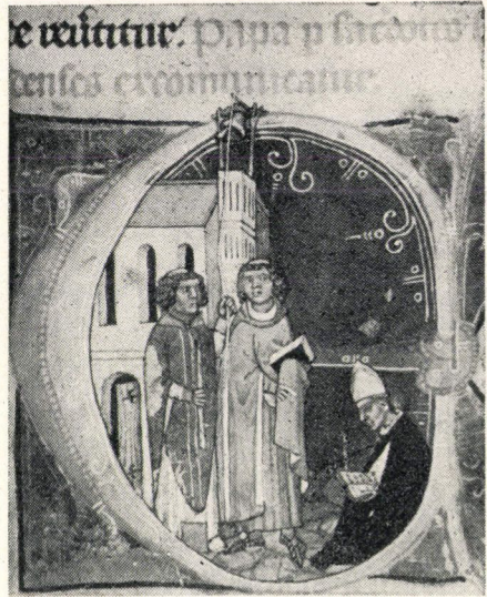
9. kép. »A pápát a budai papok kiátkozzák« (67b lap)