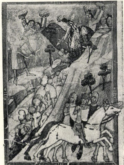
11. kép. Bazaráb vajda népe győzelme I. Károly király felett (73b lap)