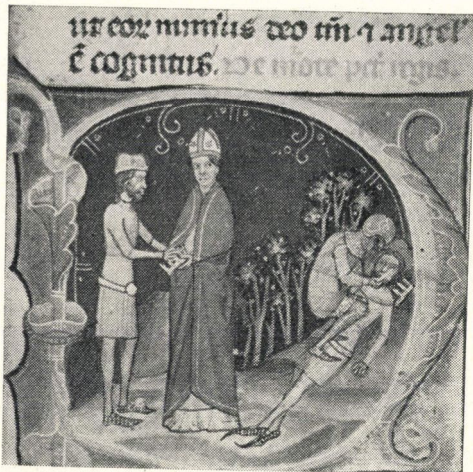
6. kép. Péter király megvakítása, András herceg átveszi a koronát (30 a lap)