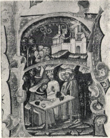
8. kép. Nándorfehérvár bevétele, a zsákmányolt kincsek elosztása (37a lap)