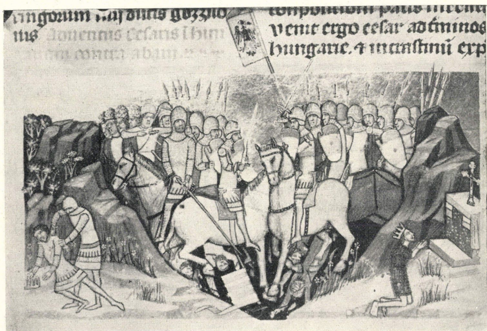
3. kép. A német császár győzelme Aba Sámuel felett, Aba meggyilkolása (25 b lap)