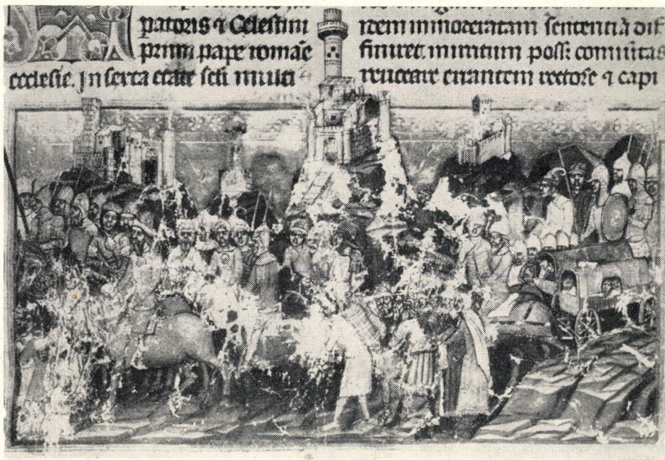
2. kép. »A magyarok első bejövetele Pannoniába« (4a lap)