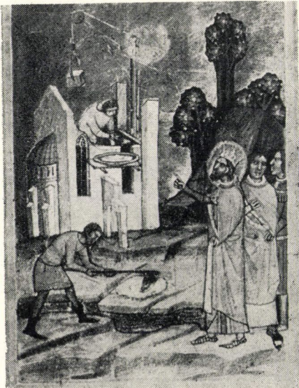
10. kép. A váradi székesegyház építése (50b lap)