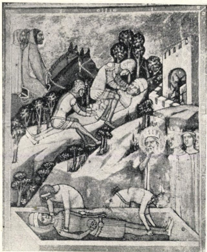
4. kép. Imre herceg sírjátétele, Vazul megvakítása (22 b lap)