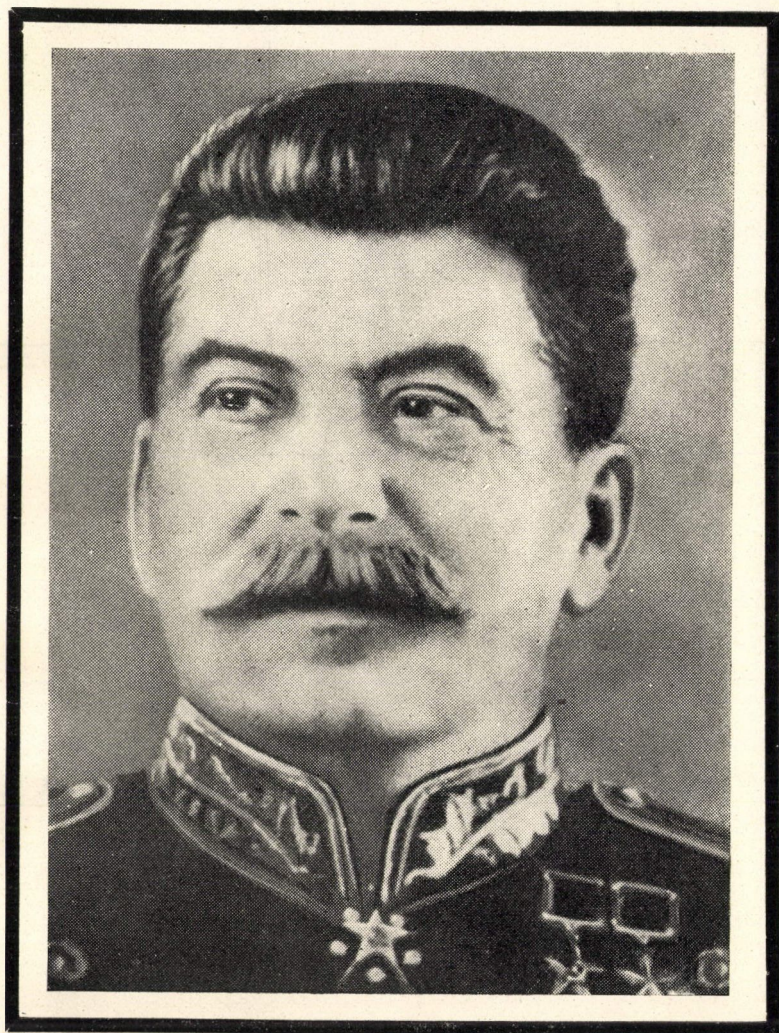
J. V. SZTÁLIN 1879—1953