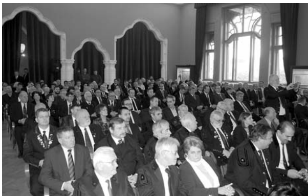
Központi Borbála ünnepség Budapesten