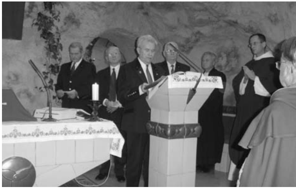
Istentisztelet a sziklakápolnában (2009)

Az egyesület 1990-től gazdaságilag függetlenné vált a MTESZ-től. A MTESZ hivatalosan a műszaki-tudományos egyesületek önkéntes szövetségévé alakult, melynek minden tagja megtartja szuverenitását.