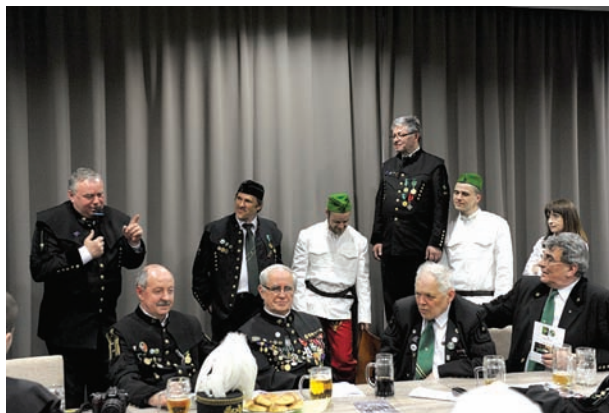
V4 országok bányász-kohász egyesületei szakestélye Hodrusbányán. Készülődés a „farbőrugráshoz”