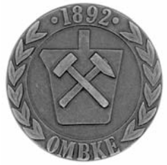
Egyesületi munkáért érem (plakett)