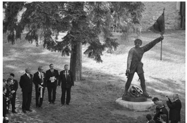
A selmecebányai '48-as Honvéd-szobor koszorúzása