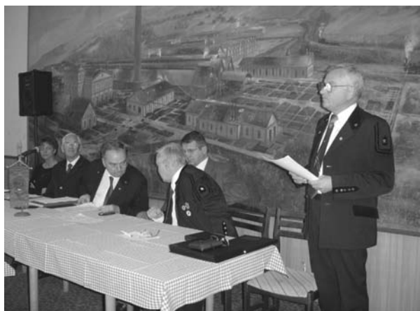
110 éves jubileumi ülés Salgótarjában 2005

Szakmai partnerekkel gyakran került sor kölcsönösen egymás meglátogatására – úgy Magyarországon belül, mint az akkor működő KGST országokban –, illetve szakmai konferenciák közös megrendezésére. A nemzetközi kapcsolatok építésében segítséget kaptunk az OMBKE központi szervezetétől és az akkor