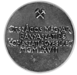
Az érme hátlapja