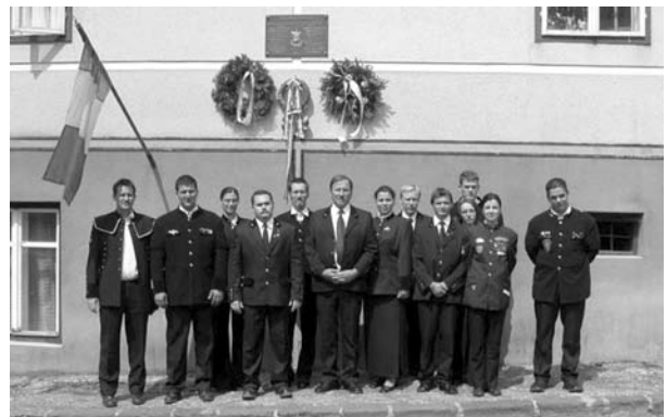
Born Ignác és Papp Simon-emléktábla avatás Kapnikbányán