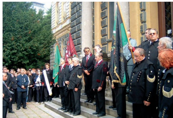
OMBKE megalapítása magyar nyelvű emléktábla avatása Selmezbányán