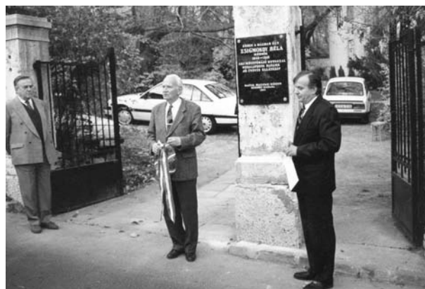
Zsigmondy Béla-emléktábla avatás

Az OMBKE 1892. évi megalakulását követően a szakemberek (geológusok, bányamérnökök) – a motorizáció fejlődésével – egyre többet foglalkoztak a szénhidrogén-bányászattal. A trianoni békediktátum okozta törés után a megcsönkített országban még fontosabbá vált a kőolajkutatás és -termelés. A kincstári és angolszász tőkével indult kutatások 1937-ben hoztak eredményt Bükkszéken és Bázakerettye térségében. A bükkszéki olajmezőnél nagyságrenddel nagyobb dél-zalai olajmező növekvő termelésével 1938-ban megalakult a MAORT (Magyar Amerikai Olajipari Rt.). Egyre többen dolgoztak a nagykanizsai székhelyű cégnél, és újabb zalai olajmezőket fedeztek fel. Napi igénnyé vált a szakemberek, munkások szakirányú képzése, továbbképzése, szakmai fórumok, rendezvények szervezése, az önképzés kedvező feltételeinek megteremtése. Erre legjobb megoldás, a már nagy hagyománnyal rendelkező Magyarhoni Földtani Társulaton túl, a szilárdásvány-bányászokat és kohászokat jól összefogó OMBKE új, a szénhidrogéniparral foglalkozó (szak)osztályának létrehozása. Bázakerettyén és Nagykanizsán dolgozott a legtöbb olajipari szakember, így Nagykanizsán alakult meg 1941. április 17-én a Dunántúli Olajvidéki Osztály. Alapító elnök dr. Papp Simon, a MAORT főgeológusa, aki később a koncepció MAORT per fő vádlottja lett.