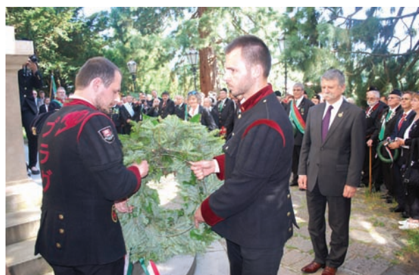
Koszorúzás az OMBKE emléktáblánál