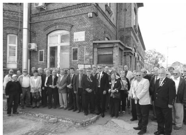
A Csepeli Fémmű emléktáblájának avatása 2013