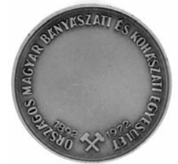
Az érme hátlapja