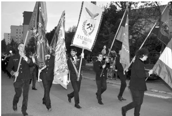
Az OMBKE a Szalamander felvonuláson