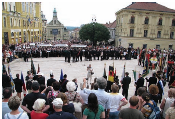
A 13. Európai Knappentag és a 8. Bányász-Kohász-Erdész Találkozó 2010, Pécs