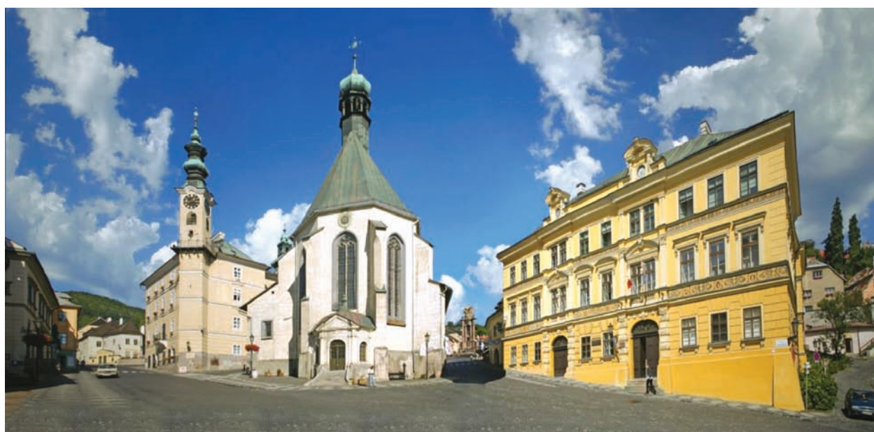
A Fritz ház Selmecebányán, az OMBKE első székhelye