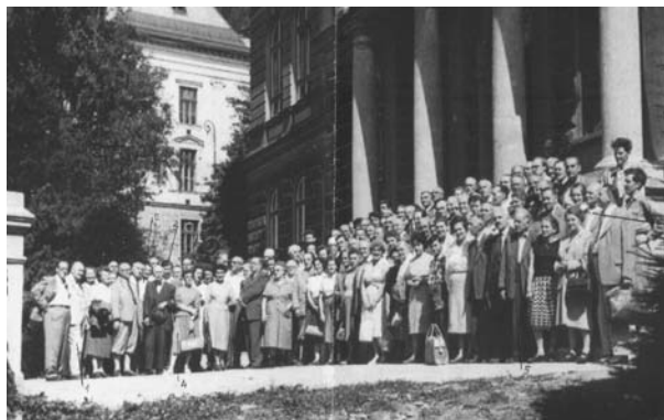
Egyesületi kirándulás Selmecbányára (1962?)

Az egyesületi taglétszám egyre növekedett, és tovább erősödött az egyesület vitafórum jellege, az egyes bánya- és kohótelepeken azonos munkát végző szakemberek véleménycseréje. Az 1963–66 közötti választási ciklusban már 85 egyesületi rendezvényt regisztráltak, melyek anyagát gyakran kiadvány formájában is közreadták. Megkezdték működésüket a szakosztályközi elnökségi bizottságok (érem, oktatási, külügyi bizottság stb.). Jelentős új feladat lett az egye-