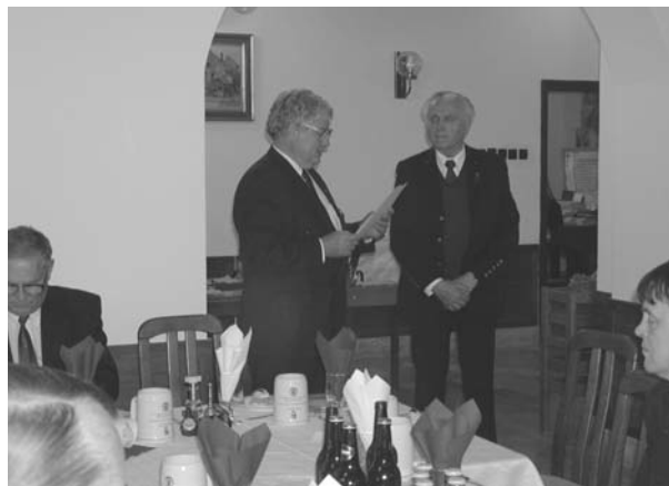
Bányamérő Továbbképző és Tapasztalatcsere Tiszteletbeli Hites Bányamérő oklevél átadása