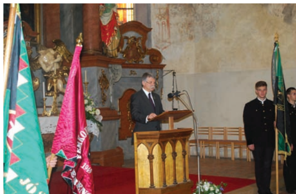
Dr. Kövér László házelnök a Szt. Katalin templomban