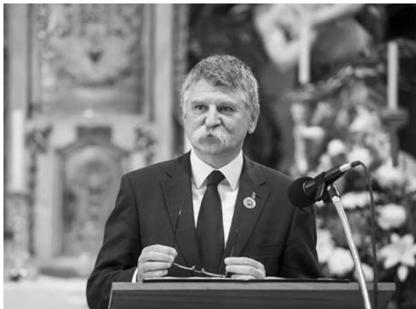
Dr. Kövér László köszönti az ünneplőket

miatt. A folyamat mélypontja 1919-ben volt, amikor a város végleg elveszítette kétszáz éves felsőoktatási intézményét, melynek eszmei és szakmai hagyatékát a Miskolci Egyetemen folyó bányá- és kohómérnök-képzés, valamint a Soproni Egyetemen folyó erdészeti oktatás gondozta és gondozza tovább.