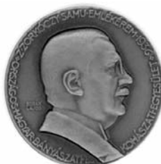
z. Zorkóczy Samu-emlékérem