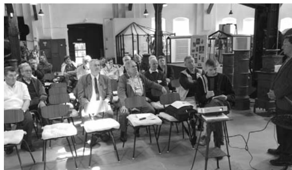
OMBKE rendezvény az Öntődei Múzeumban