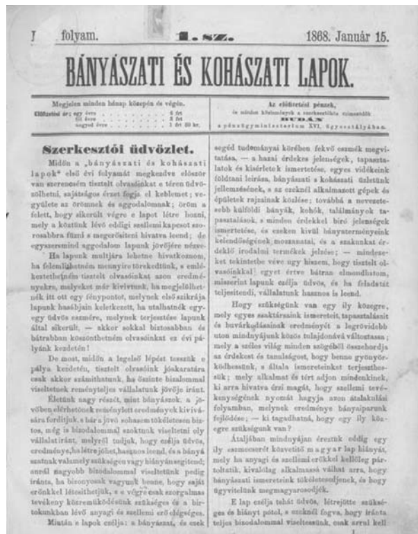
1. kép: A BKL 1868. évi 1. száma