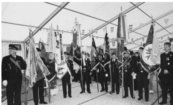
Zászlók bemutatása a Balatonfüredi Knappentagon

con és Nagybányán találkoztak szakmai eszmecsere-re a magyar, erdélyi és szlovákiai bányászok és kohászok.