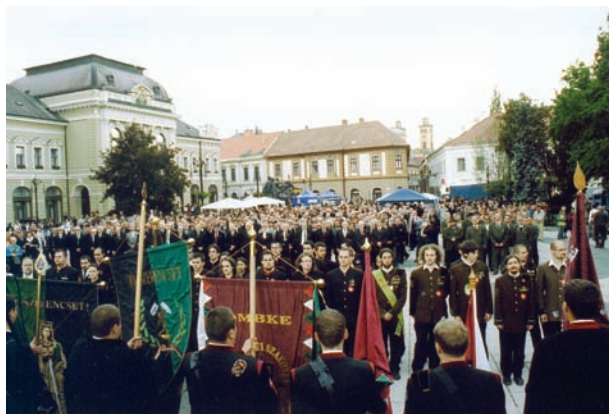
Bányász-Kohász-Erdész Találkozó Eger 2006