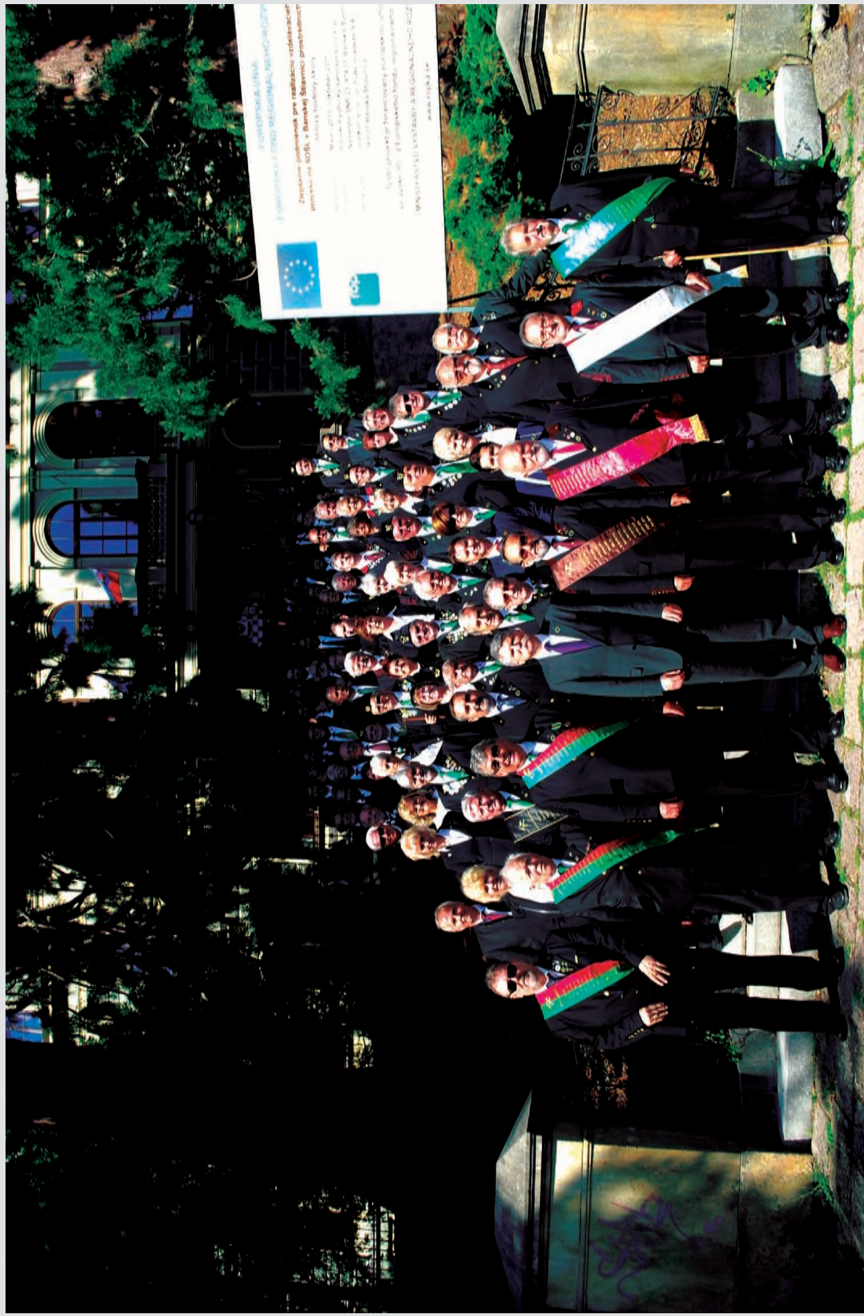
A 125 éves jubileumi ünnepség résztvevői az Akadémia lépcsőjén