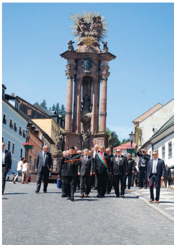
Indul a menet az Akadémiához