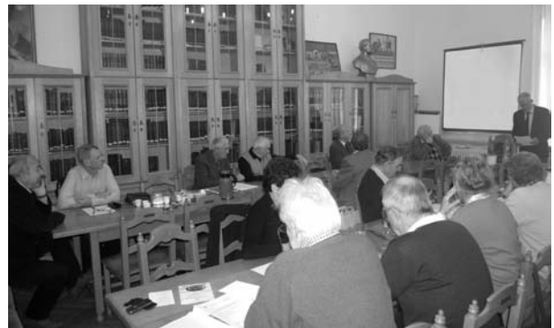
Az OMBKE Mikoviny-tanácsterme az Október 6. utcai MVAE székházban

Egyesületünk az öt megillető helyiségeket használta a MTESZ Konferencia Központban a Fő u. 68. szám alatt. A MTESZ felszámolását követően 2009-től a MVAE Október 6. utcai székházában bérlünk helyiségeket, ahol lehetőség van kisebb tanácskozások, előadások, nyugdíjas találkozók rendezésére is.