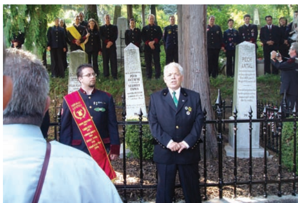
Megemlékezés Péch Antal sírjánál