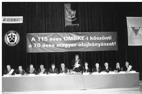
Az OMBKE 96. Küldöttgyűlése Szolnokon