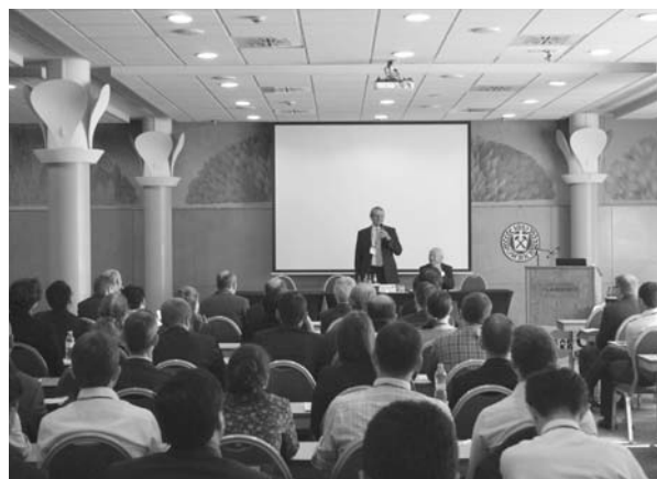
Clean Steel Konferencia 2015 Budapest

A hazai lehetőségek szűkülésével ellentétben a rendszerváltás után kiteljesedett a szakosztály nemzetközi kapcsolatrendszere és munkája. Tagja a Vaskohászati Egyesületek Nemzetközi Szövetségének, amely minden évben Düsseldorfban egyeztetési és tervezési a nemzetközi vaskohászati konferenciákat. A Clean Steel konferenciasorozat mellett ez adott lehetőséget az EUROMAT és az 1. Nemzetközi Hengerész Konferencia magyarországi rendezésére. Magyar kezdeményezésre indult meg a Tiszta Technológiák az Acéliparban, valamint az Anyag- és Energiahatékonyság az Acéliparban című konferenciák szervezése, amelyekre változó helyszínnel ma is sor kerül (az első Magyarországon voltak). Megindultak a 10. Clean Steel Konferencia szervezésének előkészületei (2018. szeptember).