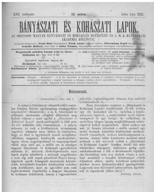
2. kép: A BKL 1892. évi 13. száma