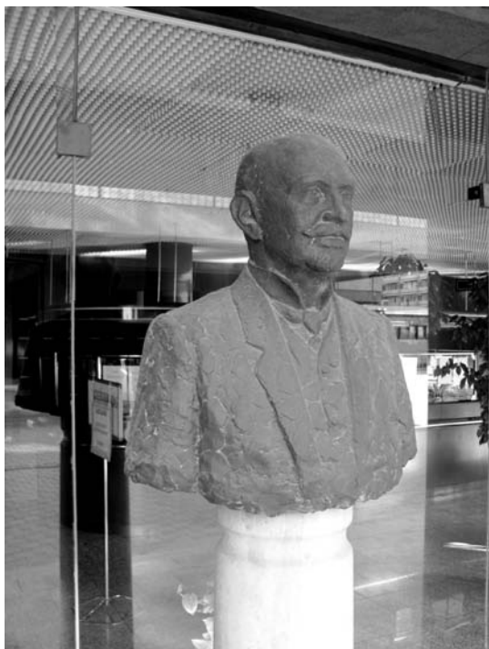
Róth Flóris mellszobra Salgótarjában

tiszteletbeli elnöke. 1942-ben 50 éves tagsága alkalmából arany oklevelet kapott. Egyesületi elnökként 1938. december 18-án megalapította a „Pécs Antal-serleget”, és 1941-ben javasolta az egyesület első elnöke, gróf Teleki Géza arcképének megfestetését, amelynek valamennyi költségét magára vállalta.