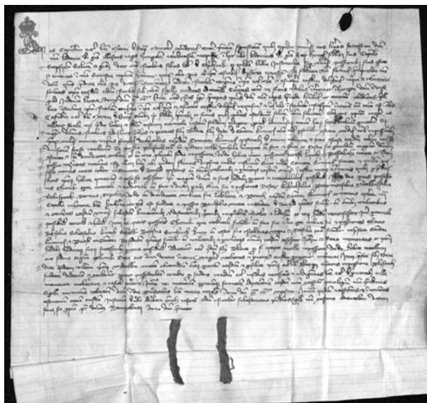
1. ábra: Az 1320 februárjában kelt okmány

A bányászat alakulásáról a következő évszázadokban nagyon kevés az információ. Maderspach Lívius szerint az ardói bányauzem 1680-1700 körül vette kezdetét, amikor a kincstár folytatott itt ólomhányászatot [3]. Ezt a tevékenységet Maderspach a német bányászok javára írja, mégpedig egy királyi rendelet értelmében, mely szerint minden új felfedezett ólomhányája után 50 forint jutalom jár. A rendelet egészen 1818-ig volt érvényben. Ennek tulajdoníja, hogy a Gömör megyei karsztvidéket részletesen átkutatták, erről árulkodnak az ardói régi aknák és horpadások, valamint a pelsőci Nagy-hegyen, az Ardócskai-pusztán, Borzován, Gencsen és több más helyen található horpadások. A Rozsnyói Híradó 1880. május 5-i számában beszámol a rozsnyói bányahivatalnál szerzett információkról, melyek szerint nagyon jelentős kutatások folytak a környéken ólomérccekre. Egészen 1745-től felsorolja a kutatásokat. Elsőként Eötvös Márton t említi, aki a rozsnyói Csengőbánya nevében kutatott az Ardócskai-hegyen. Ugyanazon évből szól egy bányamérési okmányról is a társulat ezen bányaterületéről. 1759-ben Fábry András alsósajói lakos kutat az ardói határban fedő- és feküécre Szent András név alatt. Egy évvel később ugyanezen Fábry András a bánya egynegyedét átengedi Sulyovszky Sirmiensisnek . Hasonlóan cselekszik Sebők Mihály is. Sulyovszky ezenkívül további kutatási engedélyt kér. 1765-ben Kreyszal Mihály