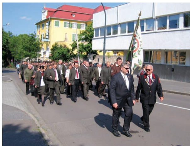
A menetet az erdészek csoportja zárja