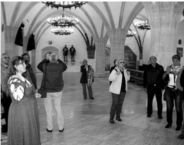
A diósgyőri vár lovagtermében

Túránk következő állomásán az 1870-től megkezdett, a diósgyőri vasmű szélnigényét kielégítő, Perces-Lyukóbánya környéki barnakőszén-bányászat megmaradt emlékei közül az