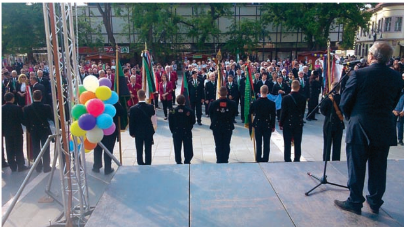
A Dobó téren felsorakozott felvonulók egy része