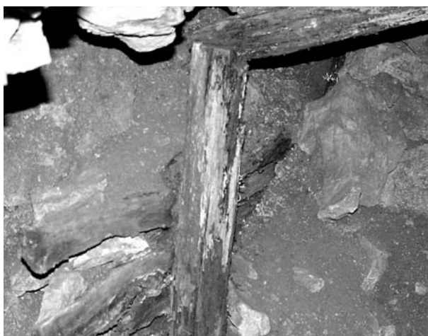
2. ábra: Középkori táró maradványa

Maderspach részletesen beszámol a bányászatról is, miszerint 1816-ban és az azt követő években a bányák, amelyekben termelés is folyt, a Sebők család tulajdonát képezték. A század második felében, az 1850-1860-as években, Pelsőcardón egy társaság a bányabirtokos, melynek fő részvényesei a Sárkány , a Gotthard , a Szontagh és a Lichard családok voltak. Ekkor állítólag már nem csak ólmot, hanem cinkércet, mégpedig szfaleritet is bányásztak. Míg korábban ólomérctermelés folyt, innen kezdve egy másik fém, a cink került előtérbe a pelsőcardói bányászatban (2 ábra).