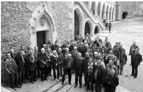
Csoportkép a várudvaron

Megnyugtató volt tapasztalni, hogy a várat évtizedekkel ezelőtt körülölelő vaskohászati létesítmények zömét lebontották és az utóbbi években a vár restaurálását megkezdték. Így a vár legnagyobb része ma látogatható. Több helyen magyar nyelvű magyarázó szöveggel is lehet találkozni. Egyébként a Dévát Vajdahunyaddal összekötő út mentén korábban működő vaskohászati kombinát üzemének ma már csak a lebontott nyomait lehet látni. Ugyanígy eltűntek a Kaláni Vaskombinát