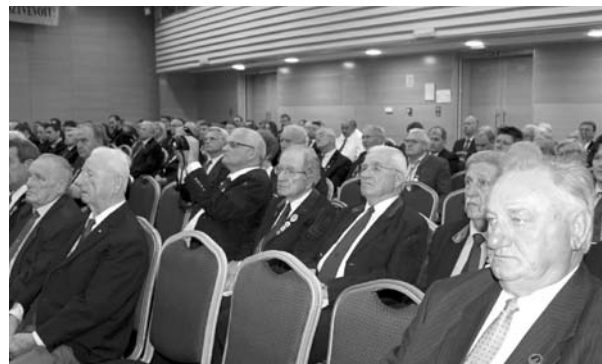
A Küldöttgyűlés résztvevői

4.) A küldöttgyűlés továbbra is szükségesnek tartja, hogy a társegyesületekkel közösen felhívják az ország gazdasági és politikai vezetésének figyelmét a bányászati és kohászati tevékenység nemzetgazdasági jelentőségére, a hazai lehetőségekre és a szükségesnek tartott intézkedésekre.