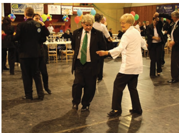
Jó hangulat és tánc a megnyitó után a sportcsarnokban