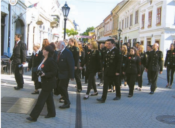
A díszfelvonulás a Széchenyi utcában halad az egyetemisták csoportja