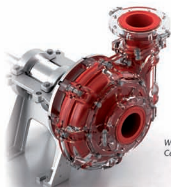
Warman® WGR Centrifugális Zagyszivattyúk