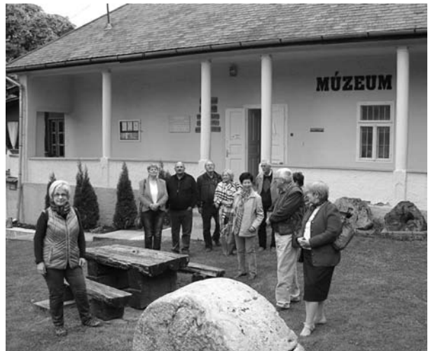
A telkibányai múzeum előtt

Edelényben, amely szintén bányász település volt, a felújított L'Huillier-Coburg kastélyt látogattuk meg. Telkibányára igyekezve útközben Vizsolyban a református templomban Károli Gáspár által 1590-ben 800 példányban készített magyar nyelvű Biblia 52 megmaradt eredeti példányának történetével és a merített papírosra történő nyomtatás sajtó-gépével ismerkedtünk meg.