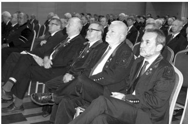
A Küldöttgyűlés résztvevői

Örömmel üdvözlöttük a vajúrképzés újbóli beindítását. Reménykedünk, hogy az oktatás beindítása mögött a most már két év múlva végző első vajúrok elhelyezkedési lehetőségét is megteremtik, s ez mindenképpen jó a bányászatnak.