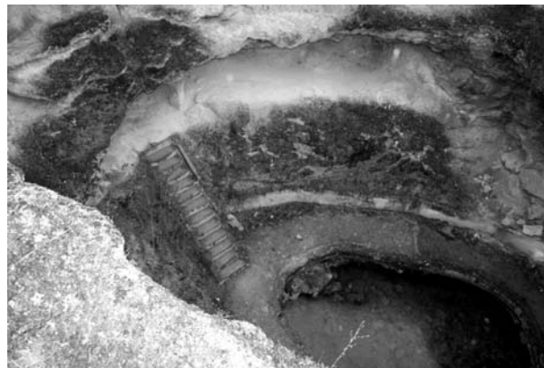
A római fürdő

A konferencia másnapján megtekintettük a gyógyfürdőt Gyógyferecson, melyet a római korban is működő gyógyfürdő területén alakítottak ki. A sziklamélyedésben a mélyben lévő meleg vizű természetes medencét ma is használják, melyet a kiépített alagúton lehet megközelíteni.