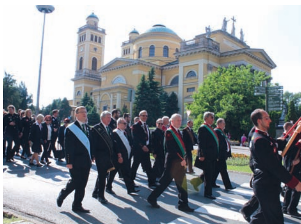
A díszfelvonulás Eger városában, az OMBKE vezetői a menet élén