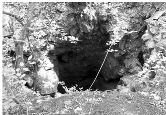
5. ábra: A 3-as számú szállítóakna maradványa

1937-1938-ban Josef Bat'a cseh vállalkozó újraindította a feltárási munkálatokat a pelsőcardói bányában [7]. A termelés megkezdésére azonban már nem került