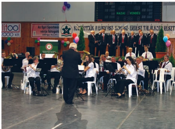
A Salgótarjáni Dalkör és Fúvószenekar műsora a sportcsarnokban