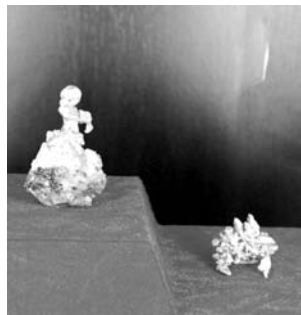
A „Balerina” nevű képződmény az Arany Múzeumban

A kirándulás másik célja Brád volt. Brád az úgynevezett „aranynégyyszög” térségében helyezkedik el. A legfontosabb bányák egy szabálytalan négyyszög sarkaiban helyezkednek el (Offenbánya, Zalatna, Nagyg, Brád). Ez a térség Európának mind középkori, mind jelenkori leggazdagabb nemesfém-bányavidéke (lásd Verespatak).