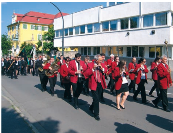
A díszfelvonulás a Klapka utcában a Szolnoki Olajbányász Fúvószenekar