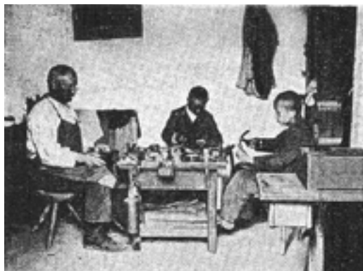
3. kép Cipésműhely

Az intézetben a pedagógusok az elméleti órákkal párhuzamosan napi kerti, mezőgazdasági és állatgondozáshoz kapcsolódó tevékenységek által készítették fel tanulóikat a munkára. Az 1929/30-as tanévben 65 növendék az intézet tulajdonát képező „4 és 23 bérelt kisholdon” konyhakerti, mezőgazdasági és állattenyésztési oktatásban részesült, két-két növendék pedig cipész- és asztalosműhelyben végzett munkát. 18 (3–4. kép) Már az intézet