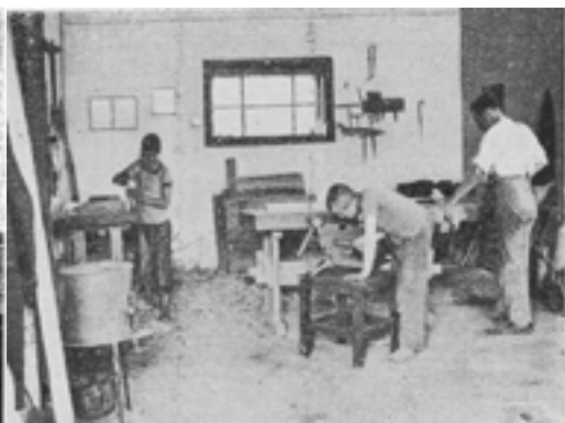
4. kép Asztalos műhely

szervezése idején szükségesnek mutatkozott az elméleti képzésben részesített növendékek foglalkoztatására külön foglalkoztató terület és épület létesítése is. Az intézet így a konyha-, virágkertészeti és a mezőgazdasági munkák részére külön földterületet bérelt. 1934 őszén fölavatták a külön telken épült, mintegy 30 növendéket befogadó munkateremmel ellátott foglalkoztató épületet, mely azt a célt is szolgálta, hogy az egyes családokhoz munkásnak kihelyezett növendékek munkanélküliség vagy betegség esetén is „otthonra találjanak”, és az újabb alkalmazásukig foglalkoztatást tudjanak biztosítani számukra. Az intézet jelentős állatgazdasággal (tehenészettel, sertés- és baromfitenyéssel) is rendelkezett, amely az intézet hús- és tejszükségletét csaknem teljes egészében fedezni tudta. Emellett – ahogy említettük – asztalos- és cipész-, valamint háziipari üzem is működött. Ez utóbbiban – főképp télen – szalma-, gyékény-, tengerihéj-lábtörőket, szőnyegeket és seprűket készítettek. A tanulók ezirányú munkatevékenysége helyhez kötött volt, huzamosabb ideig tartó, irányított munkát igényelt. Az intézet konyha- és virágkertészete, valamint a mezőgazdasága üzleti szempontból is jelentősnek bizonyult.