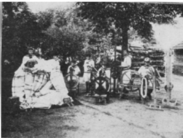
6. kép Vetőfonál készítése