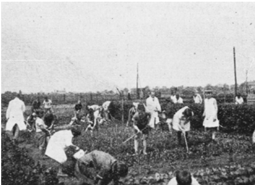
7. kép Az intézet növendékei kertmunkát végeznek

1929-ben a Gyulai Gyógypedagógiai Intézetben tehát a koedukáció megszűnt, és leányintézzé alakult át, mely a gyakorlati foglalkoztatás megváltoztatását is szükségessé tette. Pánczél – korán felismerve a munkára nevelés jelentőségét – igyekezett rugalmasan alkalmazkodni a megváltozott körülményekhez. A fiúgyermekek gyékénytépési és fonási munkája helyett bevezette a lányokat jobban érdeklő házi szövést. 1929 januárjában egy szövőszékkal kezdték meg a munkát, a szövőszékek számát pedig tanévenként fokozatosan növelték. (5–6. kép) Ez az újítás olyan sikeresnek bizonyult, hogy felvetődött, a jövőben már nemcsak az intézeti szükségletek fedezésére készítsenek termékeket, hanem eladásra is, amely plusz bevételi lehetőséget is biztosított volna az intézet számára: „Műhelyünkben elkészült eddig 600 törölköző, 139 konyharuha, 136 asztalkendő, 20 méter vászon, 30 méter kender szalmazsák és 86 méter hosszú, 145 cm szélességű lepedő. Ezek alapján jogosult az a reményiségünk, hogy a felesleges áruk eladásával intézetünk jó hírnevét és anyagi javát is előmozdíthatjuk. Házi varrodánkban 37 matrőzszabású intézeti leányruha és 136 darab nadrág készült el. Növendékink ruháit is házilag javítottuk”. 24 A szövés, varrás és az intenzív módon tanított kézimunka mellett a gyermekek a tanítási időn kívül felváltva vettek részt az intézet háztartási (takarítás, főzés, mosogatás, mosás stb.) munkáiban, valamint az állat- és