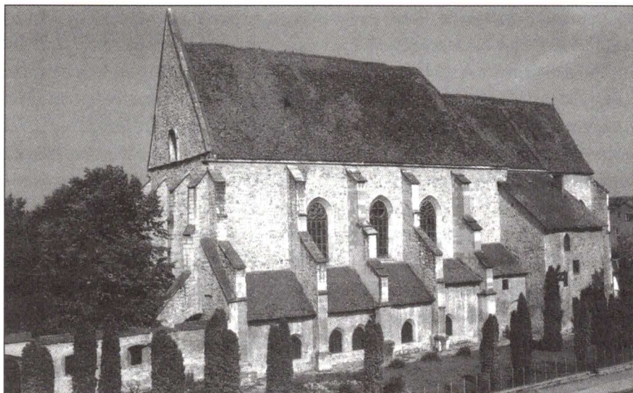
A kolozsvári Farkas utcai templom udvari nézete

Ehhez az ilyen szecskaavatóhoz hasonló megpróbáltatások is kellenek, ezek a próbatételek kovácsolják össze az abban résztvevőket. Bizonyára nem csak a diákokkal van ez így, hanem a felnőttekkel is. Ha közös erővel kell szembenéznünk egy nehézséggel, akkor annak nem várt áldásai lehetnek.