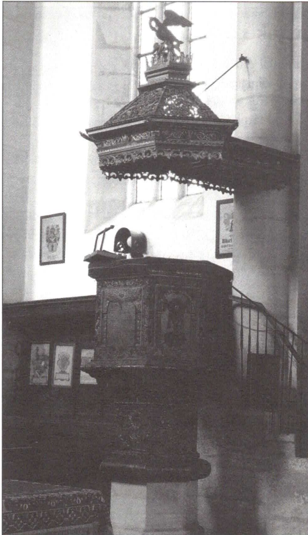
A Farkas utcai templom reneszánsz szószéke