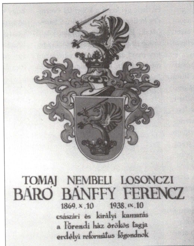
Nemesi címer a templomban. Eredetileg halotti jelentés volt.

Elhangzott Budapesten, 2004. december 14-én az egyházi iskolák pártolóiinak Szalay utcai (Oktatási Minisztérium előtti) tiltakozó gyűlésén.