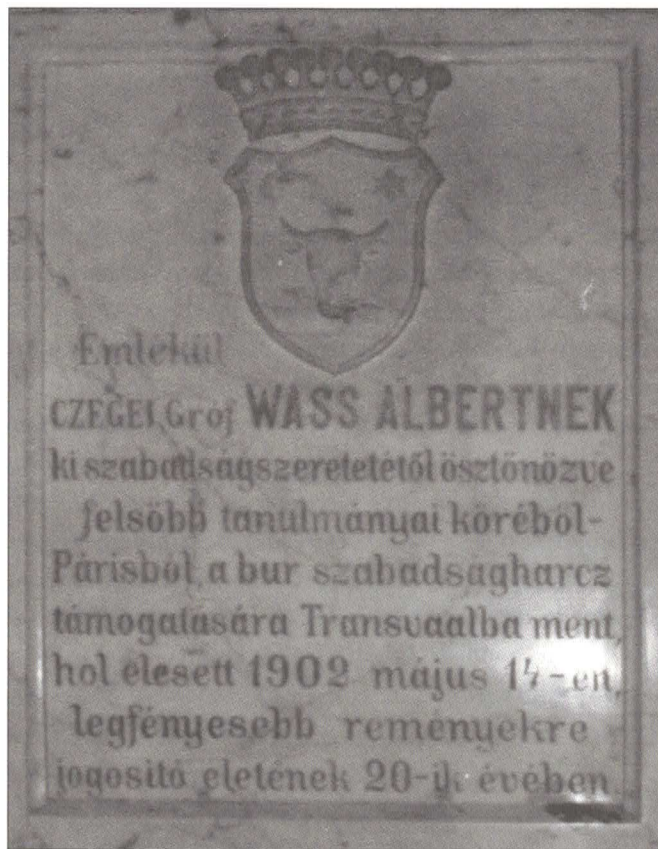
Emléktábla a Farkas utcai templom falán