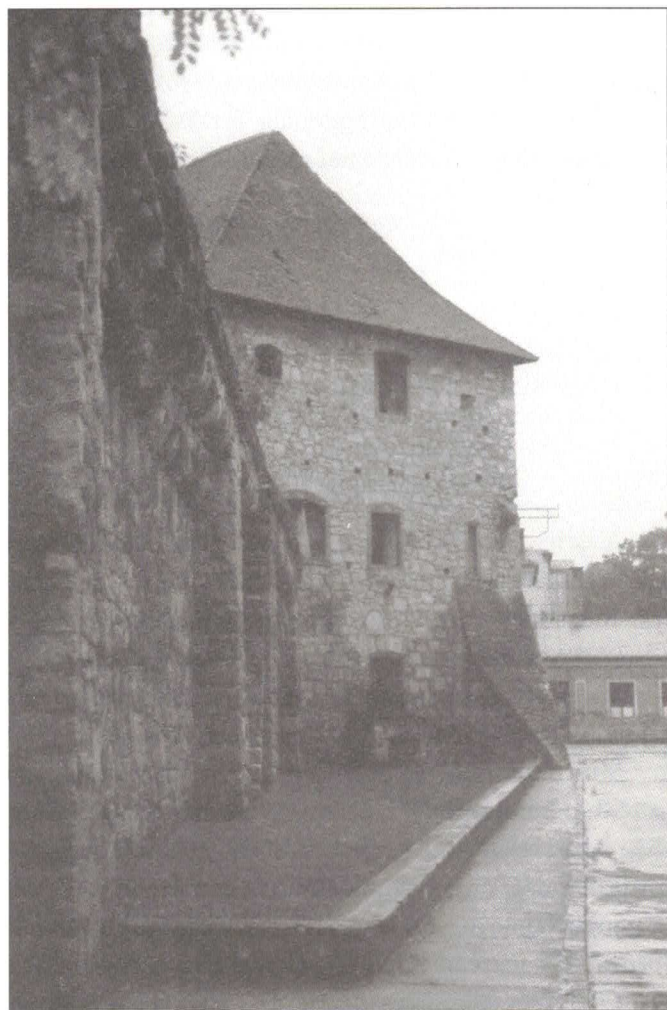
A Szabó-bástya a Farkas utca végén

Én még nem szavazhattam, mert még nem vagyok nagykorú, de ha elmehettem volna, akkor biztos, hogy igennel szavazok, hogy ne kelljen a hatá-