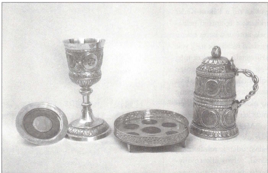
Úrasztali edények a Farkas utcai Templomban

A trianoni békediktátum számos óvodát, 12 gimnáziumot és több mint 600 elemi iskolát kényszerített a határainkon kívülre. A legnagyobb érvágást azonban a kommunista diktatúra 1948-52-es államosítása jelentette. Az évszázadok során kiérlelt struktúrában, magas színvonalon oktató-nevelő református iskolákat kitepték az egyház óvó öléből, megtiptorták és megalázták. Tanárait, diákjait és taneszközeit módszeresen összekeverték más iskolákéival, hogy még a régi iskola szellemisége se kapjon esélyt az új Magyarországon. A több mint 1000 református közoktatási intézményből egyetlen egy maradt meg, a Debreceni Református Kollégium Gimnáziuma,