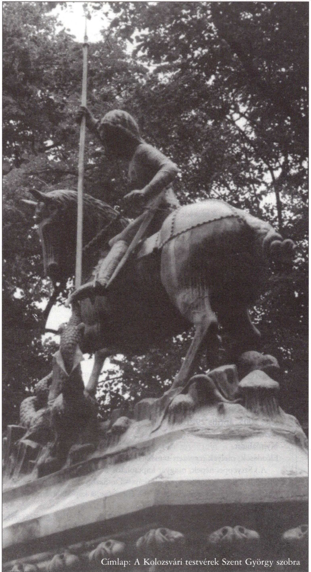
Címlap: A Kolozsvári testvérek Szent György szobra

A magyar református nevelés 475. tanévében