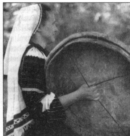
Csángó dob hejgetéshez (Moldva)

Amíg az élő népzene akár észrevétlenül is, de jelen volt, nem látzott a baj. A krízis a hetvenes évek elején vált láthatóvá, amikor a pedagógia irányítói (és egyes szűk látókörű népzenei szakemberek) kezdték elhinni, hogy végképp befejeződtek a gyűjtések, megkezdődhet végre a feldolgozó munka, és a népzene „akadálytalanul felszívódhat” a klasszikus zenébe. Talán az sem tett jót a népzene és a pedagógia kapcsolatának, hogy népzene gyűjtéssel és feldolgozással Magyarországon (és persze nem csak nálunk) elsősorban zeneszerzők foglalkoztak. Olyan ez, mintha egy koreográfus táncot gyűjt – elkerülhetetlen, hogy egy majdani színpadra állítás járjon a fejében. Nem véletlen, hogy „a néptánc kutatás Bartókja”, Martin György már nem így szemlélte a gyűjtött anyagot. A hetvenes évek nagy robbanásáról, a táncházmozgalomról így ír: 5 „A fiatal zenészek elkötelezett érdeklődése és a népzene hiteles megismertetésére, elsajátítására végzett kitartó munkája engem nagyon meghatott,