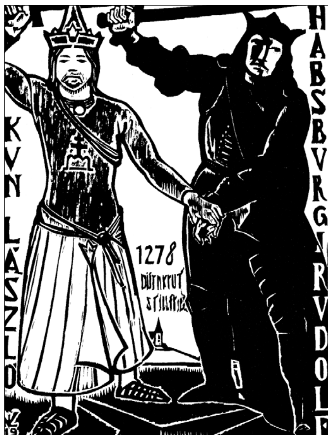
IV. (Kun) László - Habsburg Rudolf

A Jegyzetek lényegretörően fogalmazzák meg a legfontosabb magyarázati tudnivalókat, hasznos, hogy a történet szövegében csillag jelzi a későbbi magyarázatot.