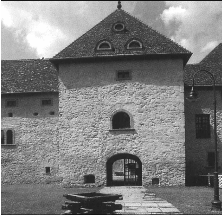
Rákóczi-kastély, Szerencs, XVI. század

kinek-kinek mindenből tehetséged szerint kiszolgáltató az egy közönséges igazságot, személyválogatás nélkül.