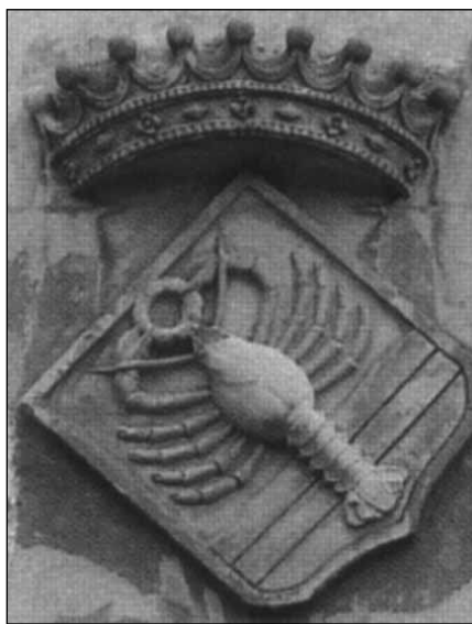
Szerencs, XVI. század

Az Istenben való gazdagság azt jelenti, hogy valójában nem az a gazdag, aki gyűjt, hanem az, aki meg tudja osztani, aki másoknak tudja adni azt, amilye van – aki a kicsiknek enni, és inni tud adni. Ebben az értelemben mégiscsak gazdagok vagyunk tehát. Ez a szép ebédlő mögöttem egy olyan hely, ahol a kicsiknek enni tudunk, adni, és inni tudunk, adni.