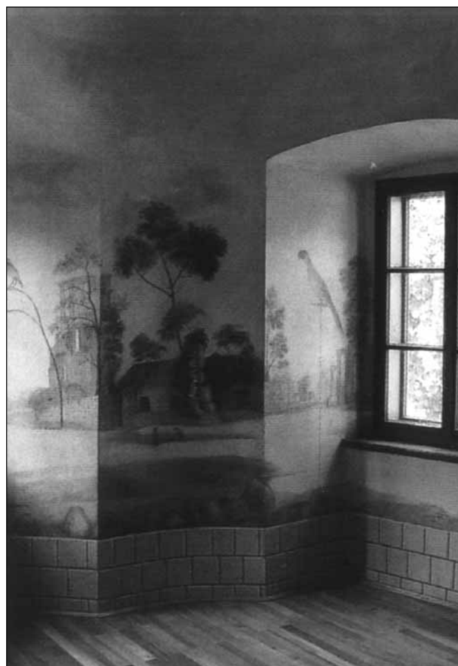
Kékededi-Melczter-kastély, XVIII. század

Az előadás közlésének nem titkolt célja a kapcsolatfelvétel és további gondolat- és tapasztalatcsere kezdeményezése református tanintézményekben hasonló munkakörben (lelkigondozó, iskola-pszichológus, ifjúságvédelmi felelős stb.) dolgozó kollégákkal.