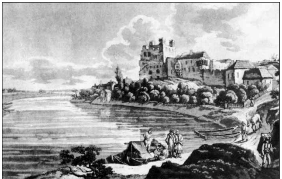
Sárospataki vár - Mathias Greischer, XVII. század

Mindeneket tanácsból, consideratióból [megfontolásból] caute [óvatosan] jól és megvizsgálva, fontolva cselekedjél, az hirtelenséget eltávoztasd, valakiket az Úristen alád ad, akár most, akár ezután jobbágyid legyenek, azokon ne kegyetlenkedjél, úgy tartsd őket, mint embereket, azokat oltalmazni, építeni, többíteni istenes utakon igyekezzed,