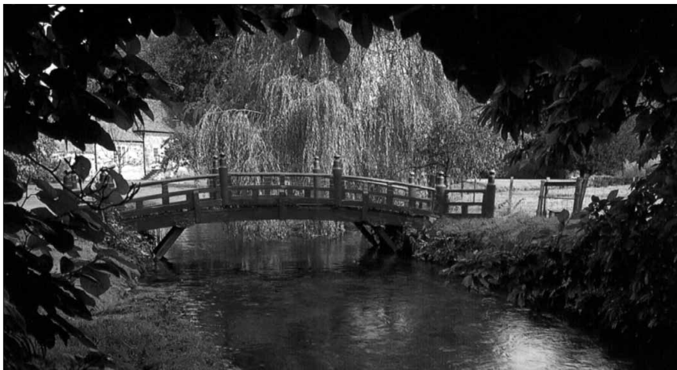
Heale House, Wiltshire

Elhangzott az ORTE centenáriumi ülésén, 2002. szeptember 28.-án Debrecenben, a Református Kollégium Dísztermében.