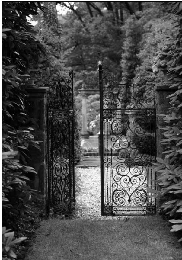
Meadowbrook Farm, Pennsylvania

Az evolúció (latin szó) jelentése: könyvtékercs kibontása, olvasása. A zsidó szintiratok ilyen könyvtékercs-