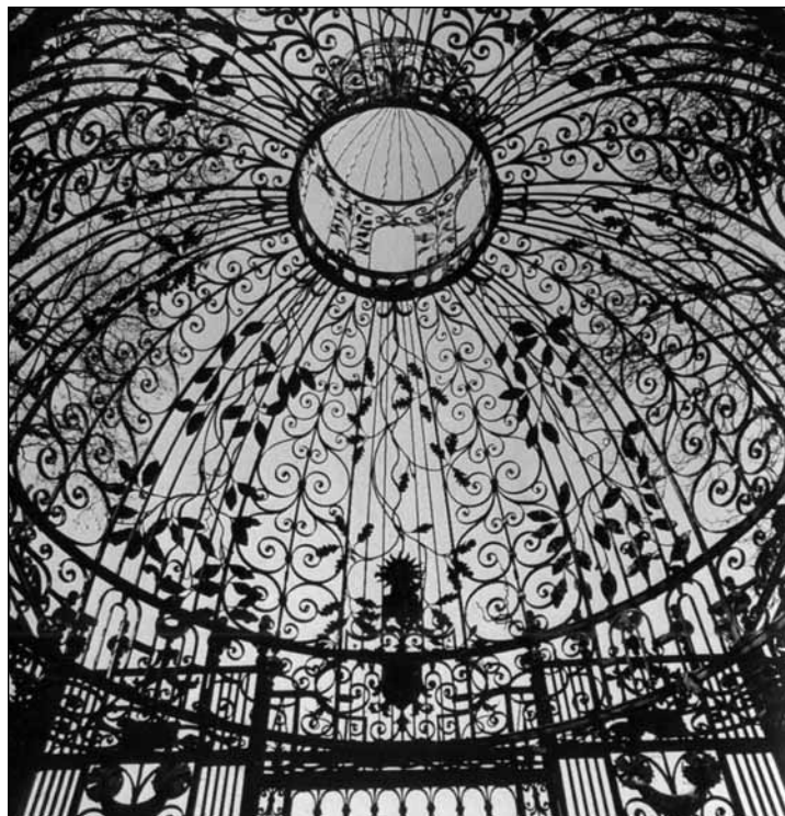
Melbourne Hall, Derbyshire

Amikor tavaly elnyertük a Magyar Ösztöndíj Bizottság és a British Council által magyar-brit kutatócse-