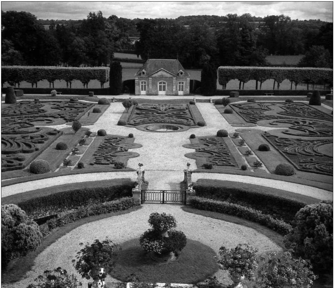
Château de Sassy, Normandy

Az egyetemeken és a diákkollégiumokban is olyan légkör uralkodott el, hogy a kultuszminisztérium bezáratta az egyetemeket, és a hallgatókat munkaszolgálatra irányították Erdélybe, ahol a közeledő szovjet csapatokkal szemben védvonalakat kellett építeniük.