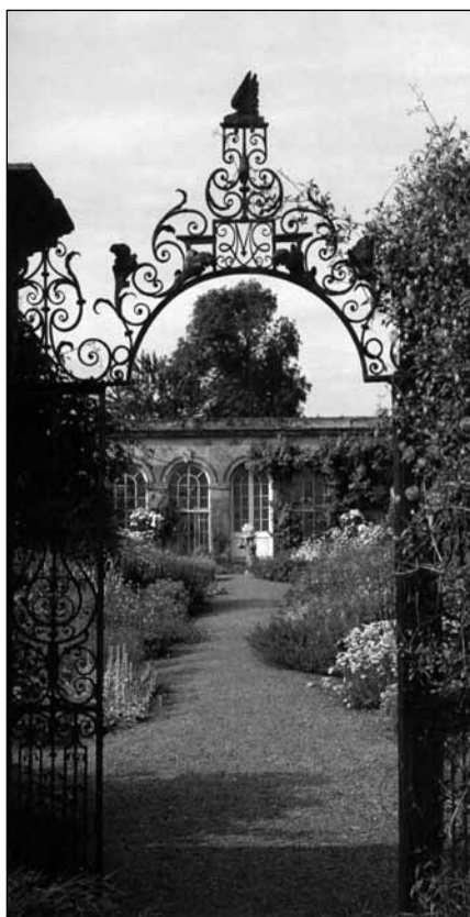
Norton Conyers, Yorkshire

ismerhetjük meg. Ezek után az euklideszi geometria ma is használt Hilbert-féle axiómarendszerét tekinthetjük át. A hosszú időn át Euklidesz szégyenfoltjának tekintett párhuzamossági axióma elhagyásával létrejövő abszolút geometria tárgyalása a második fejezet feladata. Megismerhetjük ennek néhány fontos tételét, és azokat a próbálkozá-