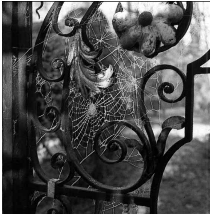
Melbourne Hall, Derbyshire

Hasonló módon szól halálos ágyán testámentumában is elhívásáról: „erős és bizonyos a hitem minden én bűneimnek bocsánatja felől oly nagyon, az én idvezítő Krisztusomnak minden hívekért, énérttem is, szegény bűnös férgeért [...] kegyelmet és engesztelést szerzett és az én igaz hitem mellett engem az idvezülendők száma közébe rendelve, [...] az én lelkemet ajánlom az én idvezítő Istenemnek ke-