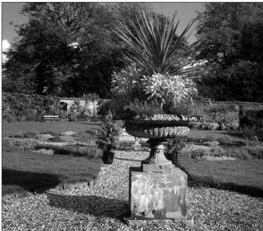
Herriard Park, Hampshire

A második kérdés: milyen hatásokra változott, alakult az élővilág? A hívők válasza: Isten a kezdet és a vég ura. Megteremtette az élőlényeket nemük szerint, s beléjük plántálta a fennmaradás, változás lehetőségeit.