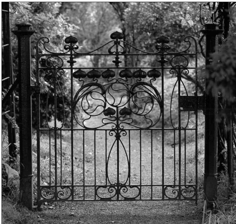
Whatton House, Leicestershire

Kálvinnak ez a gondolatmenete egyenes folyamatosságot mutat a késő középkori William Occam (Umberto Eco: A rózsza neve című hí-